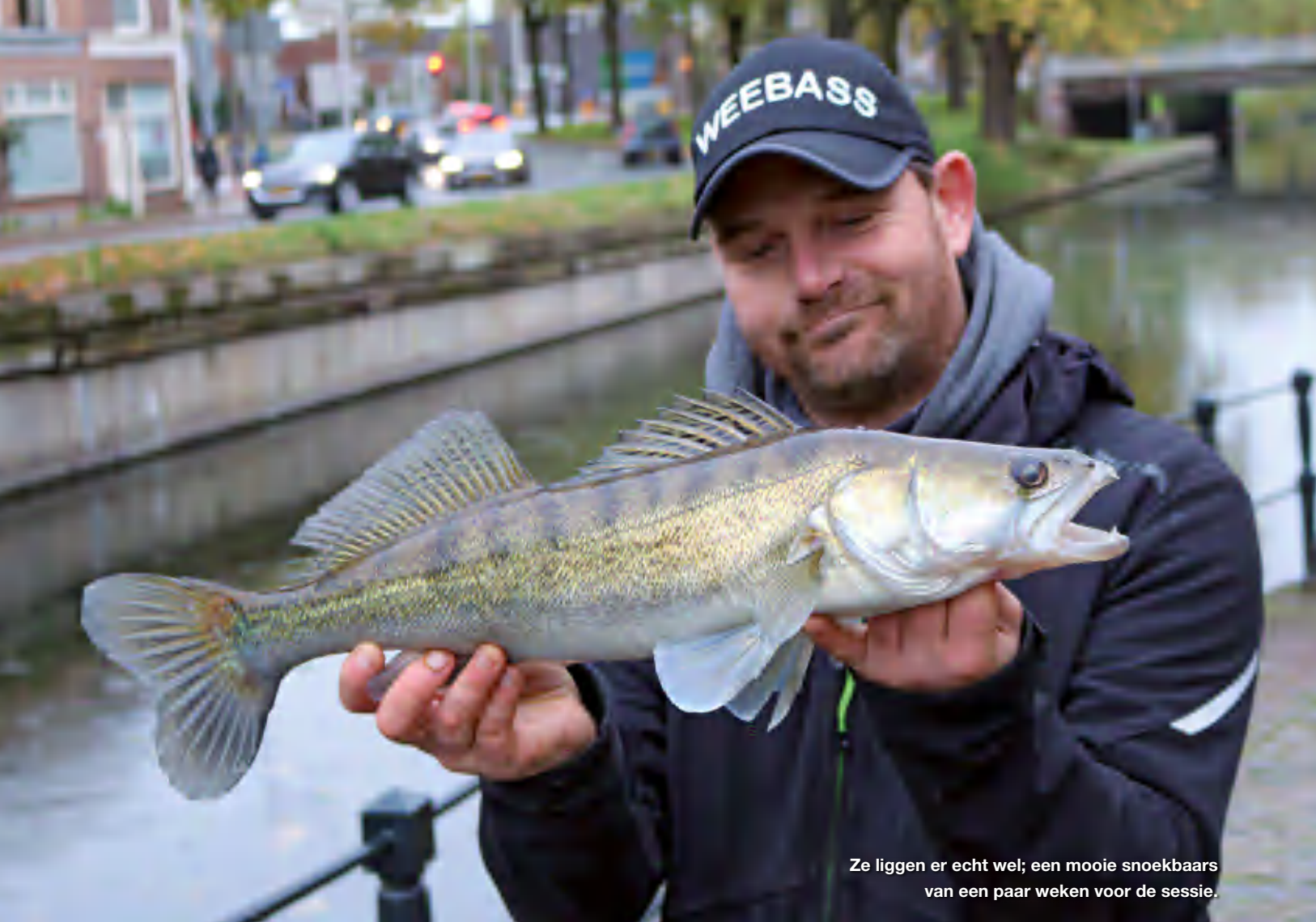
Ze liggen er echt wel; een mooie snoekbaars van een paar weken voor de sessie.

gekamde' stekken waar deze tactiek hem succes bracht. Bij de tweede brug op de singel is