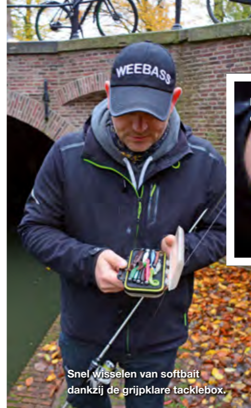
Snel wisselen van softbait dankzij de grijpklare tacklebox.