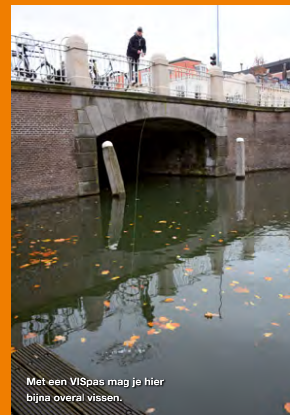
Met een VISpas mag je hier bijna overal vissen.