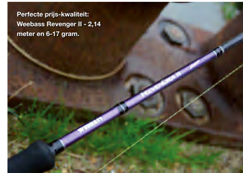
Perfekte prijs-kwaliteit: Weebass Revenger II - 2,14 meter en 6-17 gram.

TIP: neem je streetfishing serieus, dan kun je niet zonder een schepnet met een hele lange, telescopische steel. Een meter of 5 is echt niet overdreven. Sterker nog, je kunt dan vanaf plekken vissen waar iemand zonder of met kortere steel never nooit vis kan landen!