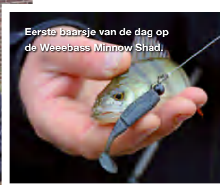
Eerste baarsje van de dag op de Weebass Minnow Shad.