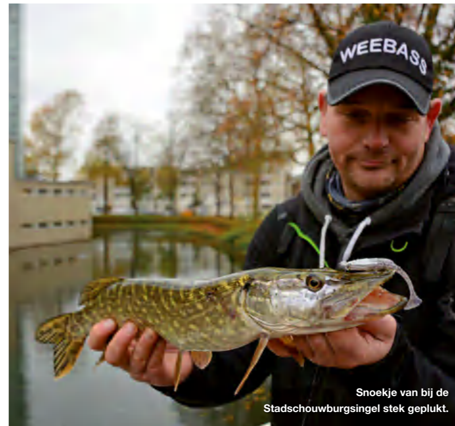
Snoekje van bij de Stadschouwburgsingel stek geplukt.