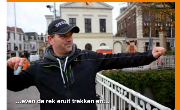
...even de rek eruit trekken en...