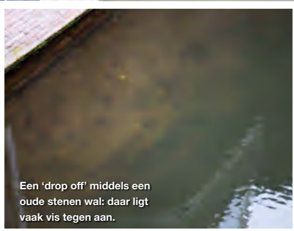
Een 'drop off' middels een oude stenen wal: daar ligt vaak vis tegen aan.