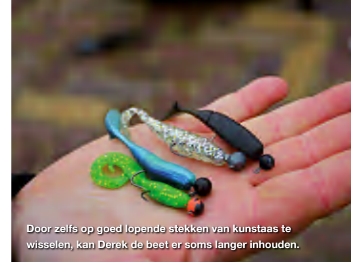
Door zelfs op goed lopende stekken van kunstaa's te wisselen, kan Derek de beet er soms langer inhouden.

water wordt afgevist, maar als daar ook geen beet komt, is het tijd om te verkassen naar een volgende stek.