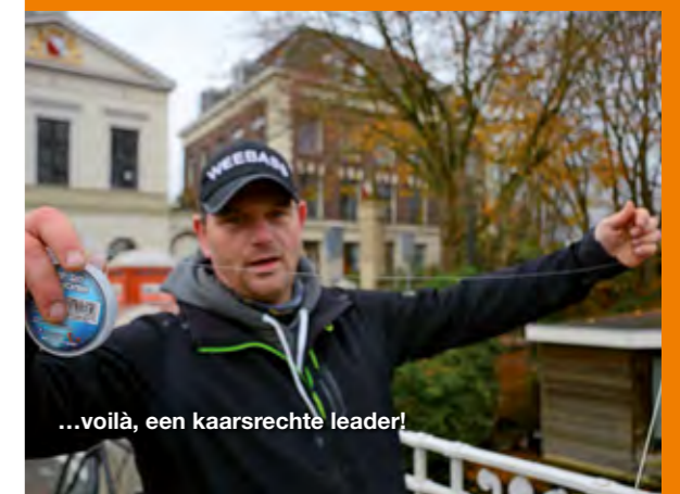
...voilà, een kaarsrechte leader!