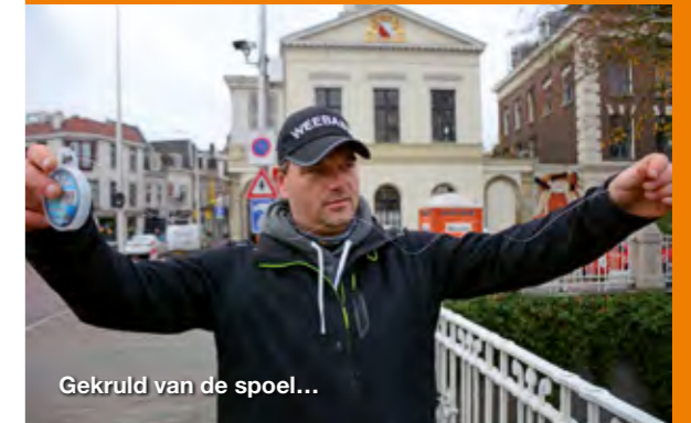
Gekruld van de spoel...

Tip: Om de 'kringels' uit het fluorocarbon te halen trek je er een paar keer hard aan en je zult zien dat het geheugen 'gewist' wordt. Het resultaat is een kaarsrechte lijn. Voor wie een goede fluorocarbon zoekt: Derek is meer dan te spreken over die van Savage Gear, een echte aanrader!