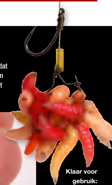
Klaar voor gebruik: knettergoed winteraas!