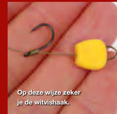
Op deze wijze zeker je de witvishaak.