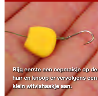
Rijg eerste een nepmaïseje op de hair en knoop er vervolgens een klein witvishaakje aan.

Als laatste een methode om maden te combineren met een ander aas, zoals een nep maïskorrel. Hiermee krijg je een wat groter en opvallender haakaas. Deze rig bestaat uit een round bend model witvishaakje maatje 12 dat aan het uiteinde van de hair is geknoopt. De maïskorrel wordt op de hair geregen en vervolgens worden de maden op het kleine haakje geprikt. Tot slot duw je de haakpunt van het witvishaakje terug in de maïskorrel. Met een drijvende maïskorrel krijg je een heel langzaam zinkend aasje, met aan de bovenkant nog een paar bewegende maden. Over die visuele prikken: de maïskorrel hoeft niet per se een natuurlijke kleur te hebben, dus ook hier zijn de mogelijkheden om te experimenteren groot.