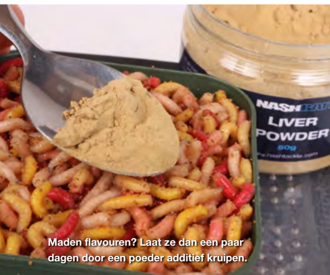
Maden flavouren? Laat ze dan een paar dagen door een poeder additief kruipen.

vloeibare liquid heeft weinig zin. Als je niet oppast maak je ze allemaal drijvend! Kies daarom voor een poeder additief, dat je een paar dagen van tevoren al toevoegt. Een eetlepel sterk geconcentreerd additief, zoals inktvis- of leverpoeder, is vaak voldoende. Je kunt de maden ook een aantal dagen door droge stickmix