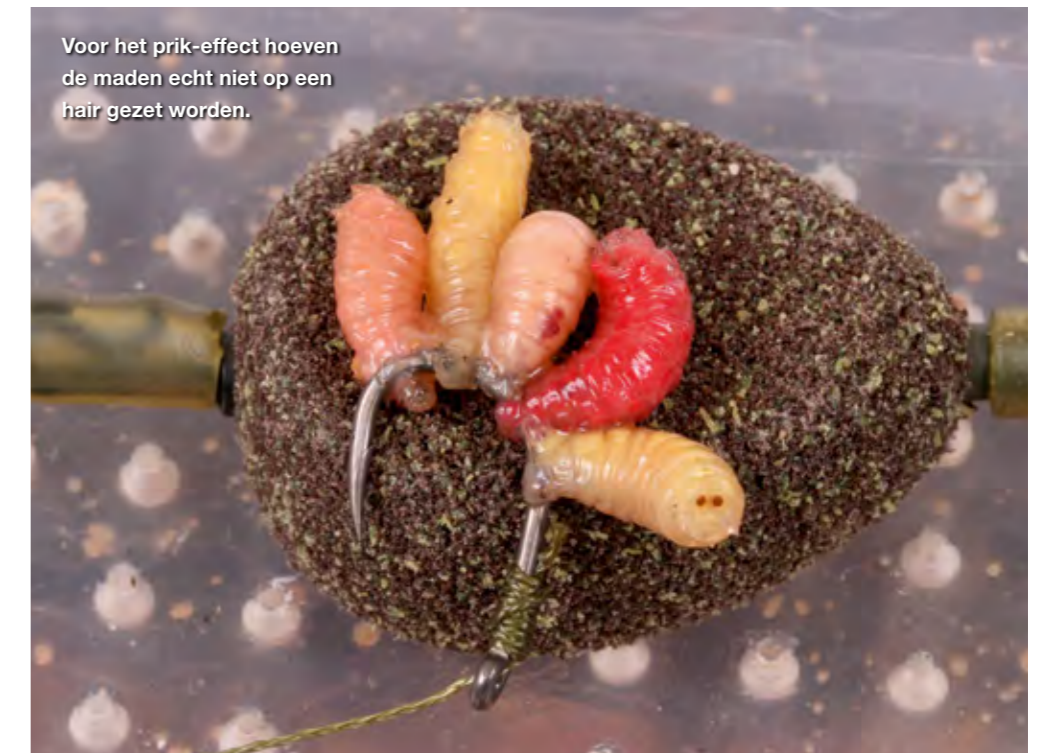
Voor het prik-effect hoeven de maden echt niet op een hair gezet worden.

dan is het absoluut het proberen waard om eens met maden aan de slag te gaan. Wat dacht je van een feloze nepmaïskorrel met enkele witte maden erboven? Of gewoon wat maden direct op de haak aan een subtiele, schuivende montage? Ik weet zeker dat er heel wat stekken zijn waar je met zo'n aanpak meer karper gaat vangen dan met de traditionele winteraanpak! ■