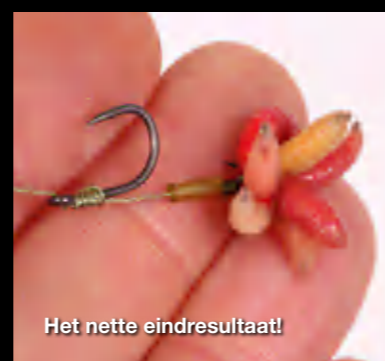
Het nette eindresultaat!