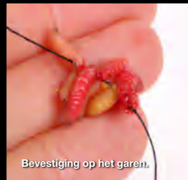
Bevestiging op het garen.