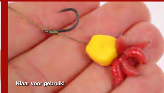
Klaar voor gebruik!

of ander lokvoer laten kruipen; de mogelijkheden zijn bijna eindeloos. In Engeland kun je nog van allerlei kleuren maden kopen, maar opmerkelijk genoeg heb ik nog geen verschil in vangsten kunnen opmerken. Best vreemd, aangezien in de boilievisserij wel de algemene consensus is dat bepaalde, fel gekleurde haakaasjes beter scoren ten opzichte van een andere kleur.