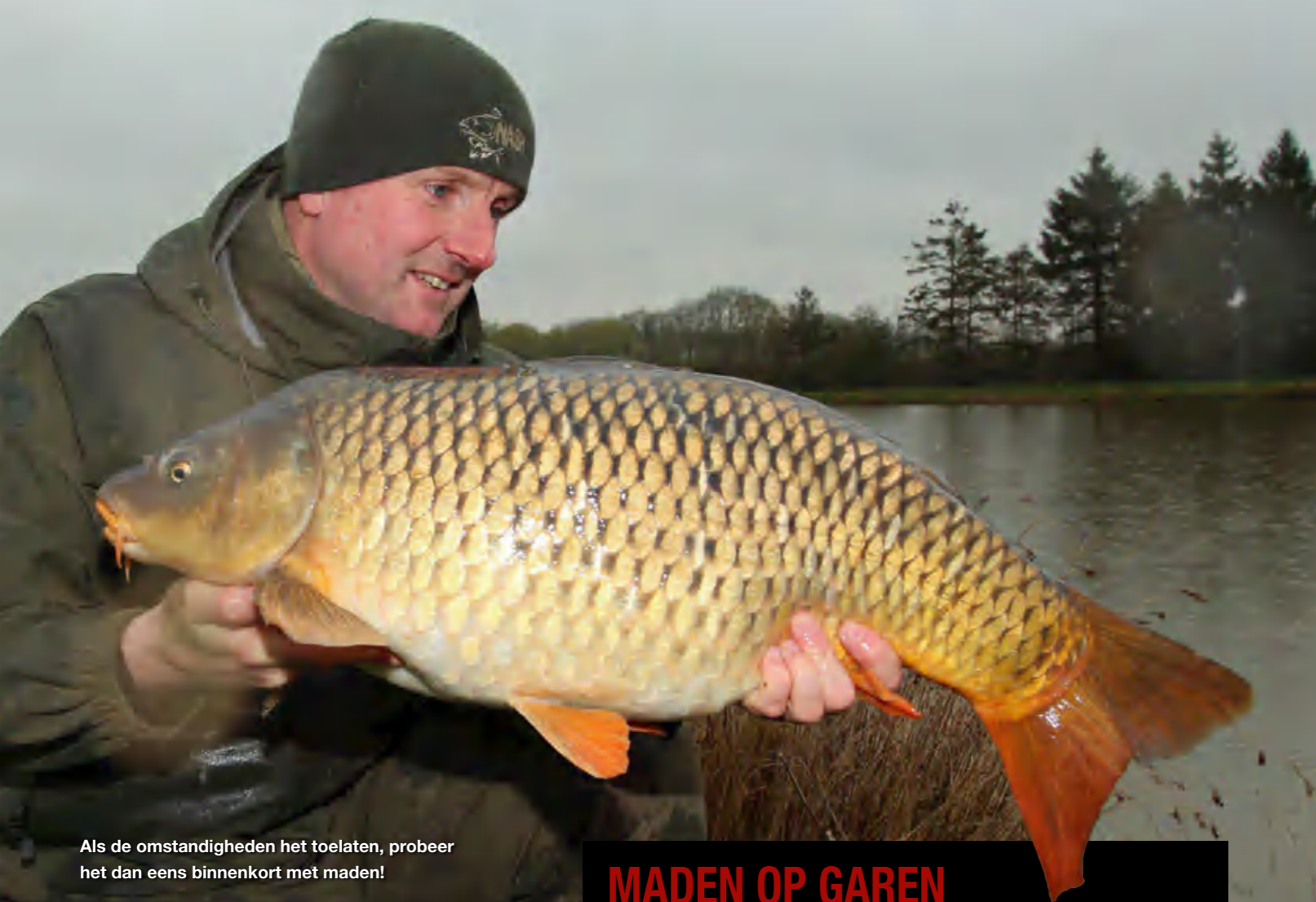
Als de omstandigheden het toelaten, probeer het dan eens binnenkort met maden!