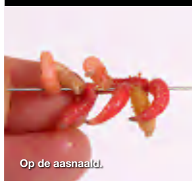
Op de aasnaald.