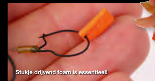
Stukje drijvend foam is essentieel!