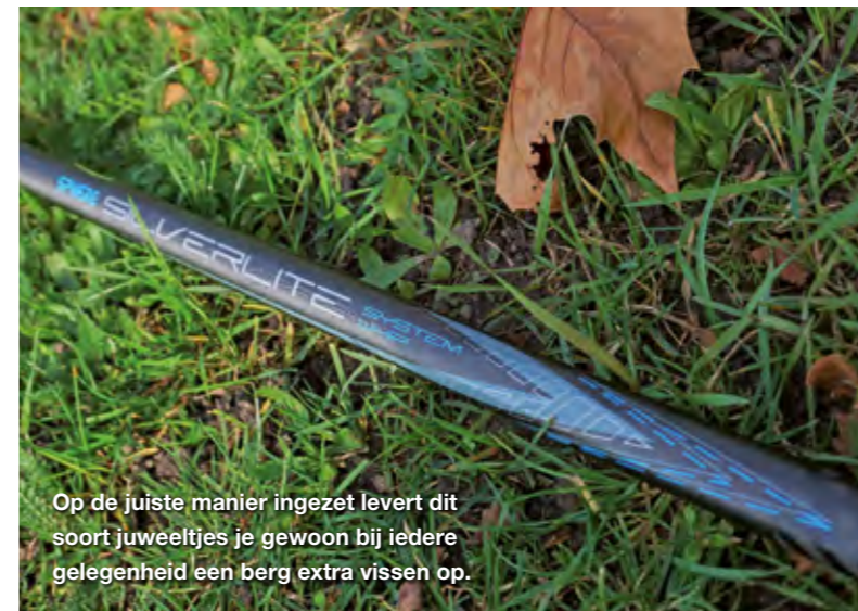
Op de juiste manier ingezet levert dit soort juweeltjes je gewoon bij iedere gelegenheid een berg extra vissen op.

gezet met enkele loodhagels, en met daaronder enkele valloodjes. Bij het gebruik van lichtere dobbers, 1 gram of minder, worden uitsluitend loodhagels op de vislijn gezet. De tuigjes in hun viskist zijn met losse hagels op de standaardmanier op de lijn geknepen, dus een ketting dat het hoofdlood vormt, met daaronder enkele valloodjes. Deze valloodjes geven je ook de mogelijkheid om wat dichter bij de haak te schuiven. Dat is met name handig wanneer het aas tijdens het zakken te vaak wordt onderschept door kleine visjes; iets dat vaak gebeurt bij dit soort visserij. Eerlijk is eerlijk, ik zag van beide Swartjes een ware masterclass vandaag. In de directe omgeving van de woonplaats van Mandy en Twan zijn verschillende goede jachthavens waarin ze vaak vissen. Zo hebben ze inmiddels al veel ervaring opgedaan met dit soort visserij en dat is goed te zien op een dag als vandaag.