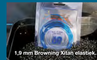
1,9 mm Browning Xitan elastiek.

Haken: Browning Sphere Classic maat 14 en 16. Dit zijn lichtgewicht, sterke langsteelhaakjes. Een ideaal haaktype voor het vissen met casters, dat in Elburg vaak aas-soort nummer één is.