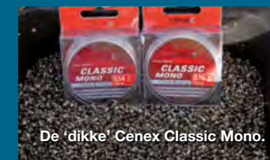
De 'dikke' Cenex Classic Mono.