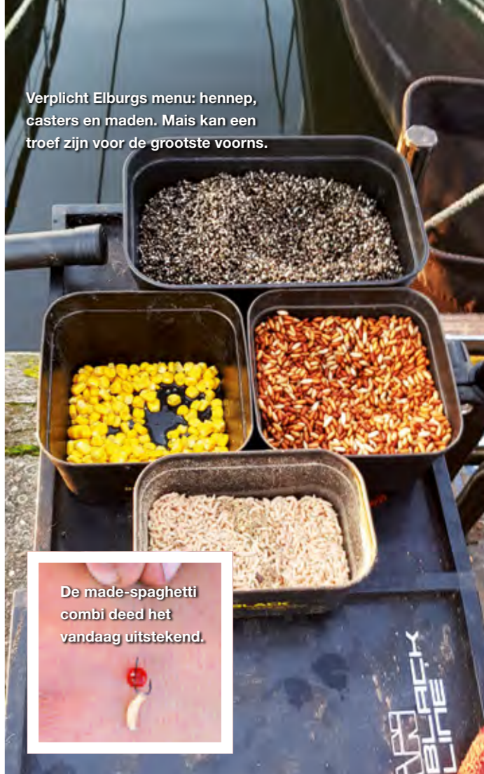
De made-spaghetti combi deed het vandaag uitstekend.

Verplicht Elburgs menu: hennep, casters en maden. Mais kan een troef zijn voor de grootste voorns.