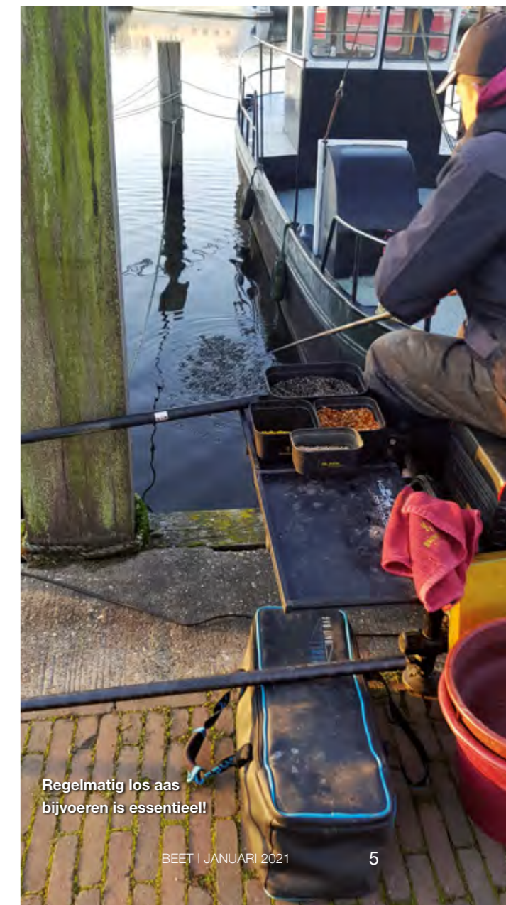
Regelmatig los aas bijvoeren is essentieel!