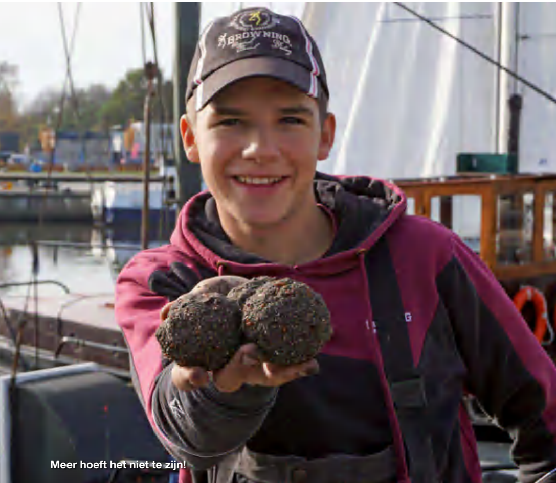
Meer hoeft het niet te zijn!

aanwezig is. Toch zie ik hier voor het eerst een nieuw fenomeen: jagende roofbleien aan de oppervlakte. Regelmatig wordt de relatieve rust verstoord door roofbleien die midden tussen alle kringetjes schieten en met hun staart in het rond slaan. In het buitenland zie je dat vaker; op deze wijze worden de vele alvers voor even verdoofd en kunnen ze hen probleemloos pakken en opeten. Hier proberen ze dus precies hetzelfde te doen, maar dan met de voorns en blikken.