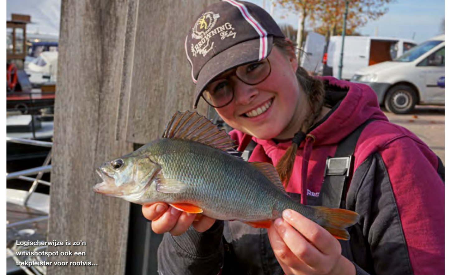
Logischerwijze is zo'n witvishotspot ook een trekpleister voor roofvis...

voerd, waarin wel gekiemde hennep, casters en ook wat maiskorrels vermengd zijn. Verder wordt er de gehele dag geen kruimel lokvoer bijgevoerd. Echter losse gekiemde hennep en casters zoveel te meer. Niet in grote hoeveelheden, maar wel constant, dan heb ik het over iedere minuut, zakt er aas naar beneden. De perfecte voertactiek voor dit soort wateren. Mits de vis aanwezig is komt er zo alleen maar meer en meer vis op de voerstek zonder die vissen te overvoeren.