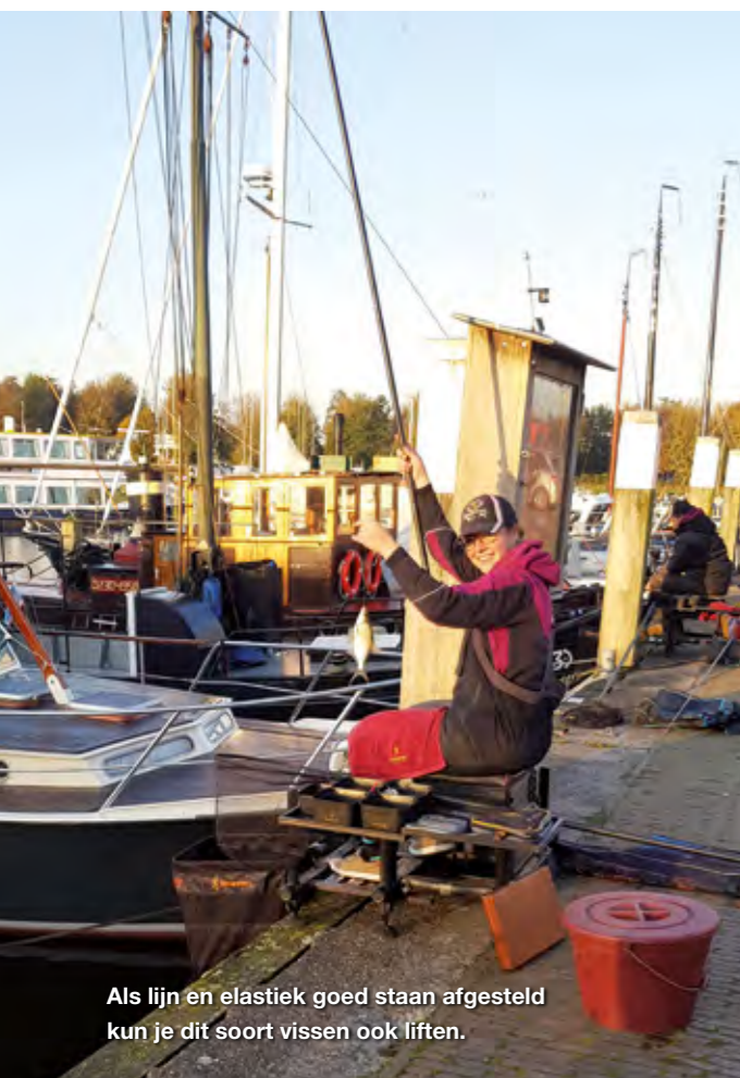
Als lijn en elastiek goed staan afgesteld kun je dit soort vissen ook liften.