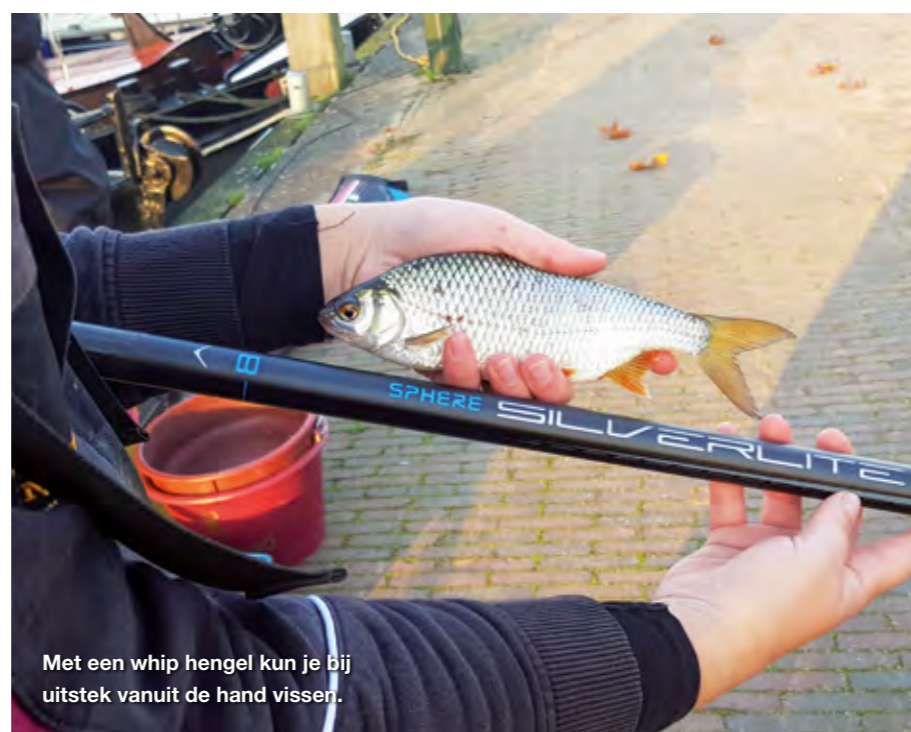
Met een whip hengel kun je bij uitstek vanuit de hand vissen.