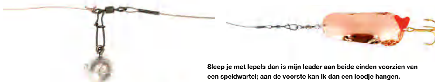
Sleep je met lepels dan is mijn leader aan beide einden voorzien van een speldwartel; aan de voorste kan ik dan een loodje hangen.