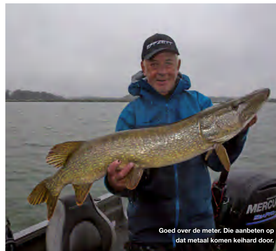
Goed over de meter. Die aanbeten op dat metaal komen keihard door.