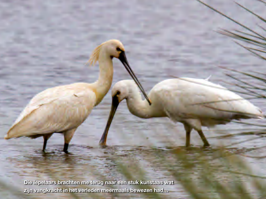
Die lepelaars brachten me terug naar een stuk kunstaas wat zijn vangkracht in het verleden meermaals bewezen had...

V issen is voor mij een onmisbaar deel van mijn leven, maar ik kan alleen van het vissen genieten wanneer ik vrij en in de natuur ben. Tevens ben ik ook iemand die zijn hengels