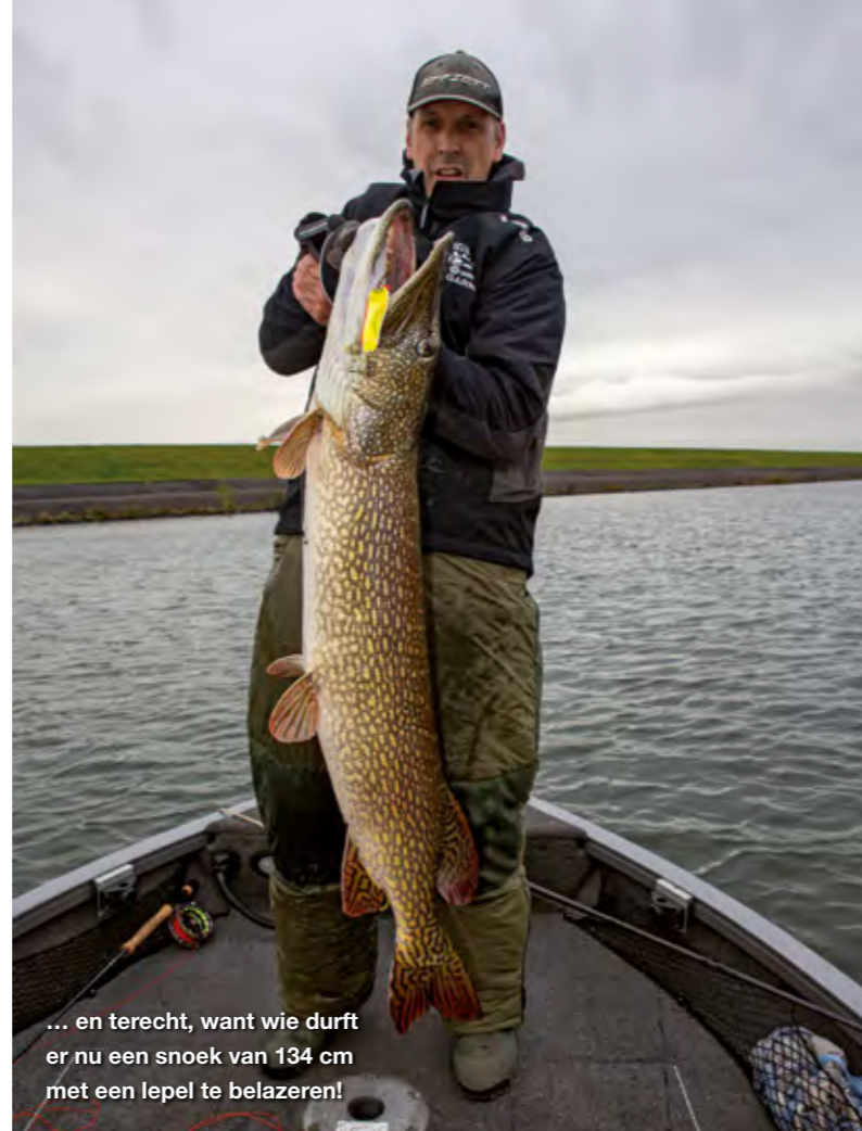
... en terecht, want wie durft er nu een snoek van 134 cm met een lepel te belazeren!

namelijk met een lichtere, dunbladige lepel, en heb je een beetje druk van de wind op de lijn, dan verlies je snel de controle over de lepel en dat is het laatste wat je gebruiken kan. Natuurlijk kun je recht voor je uit werpen, maar vooral vanuit een drijvende boot is dit niet wat je noemt een slimme strategie. Zijwaarts werpen, zodat je in de drift elke worp in onbevestigd water vis, rendeert altijd beter!