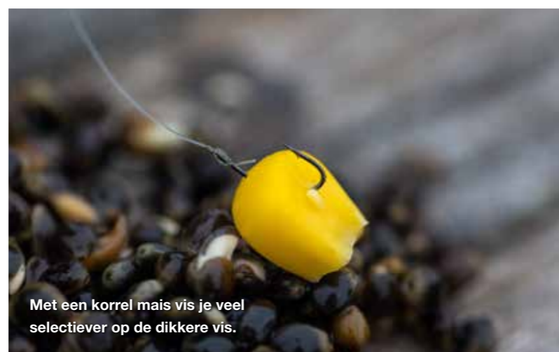
Met een korrel mais vis je veel selectiever op de dikkere vis.

Zo'n kenmerkende haven die in de winter bomvol ligt met vis is te vinden in Schagen. Hoewel je hier vele grote voorns vindt, zijn er vooral