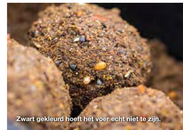
Zwart gekleurd hoeft het voer echt niet te zijn.