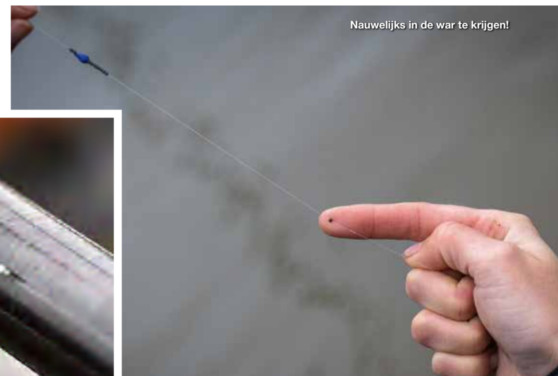
Nauwelijks in de war te krijgen!

Regelmatig wisselen tussen verschillende stekken is ook zeker belangrijk!