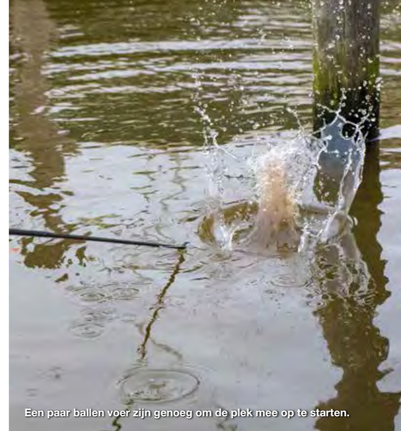
Een paar ballen voer zijn genoeg om de plek mee op te starten.

Zeker op plekken waar woonboten liggen, zijn vaak enorme scholen vis te vinden