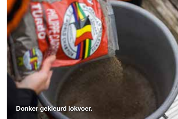
Donker gekleurd lokvoer.