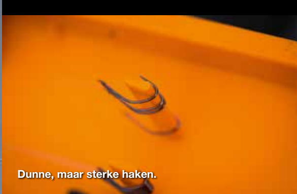
Dunne, maar sterke haken.