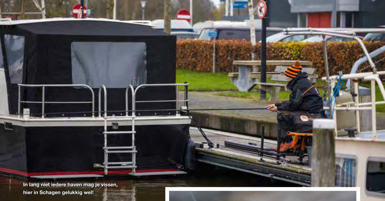
In lang niet iedere haven mag je vissen, hier in Schagen gelukkig wel!

V erspreid door Nederland zijn er tal van havens die in verbinding staan met groot openbaar water. Aangezien op het grote water weinig beschutting is te vinden in de wintermaanden, schoolt een groot gedeelte van de vis samen in onder andere (jacht) havens. Hier is vaak meer beschutting te vinden en bovendien is hier het water net een tikkeltje warmer. Zeker op plekken waar woonboten liggen, zijn vaak enorme scholen vis terug te vinden. Logisch, want deze stralen altijd iets van warmte uit. In de regel is in iedere haven 's winters wel een visje te vangen zolang er voldoende beschutting is. Hierbij is het wel belangrijk om goed te kijken of er wel gevist mag worden! Dit kan namelijk per haven behoorlijk verschillen.