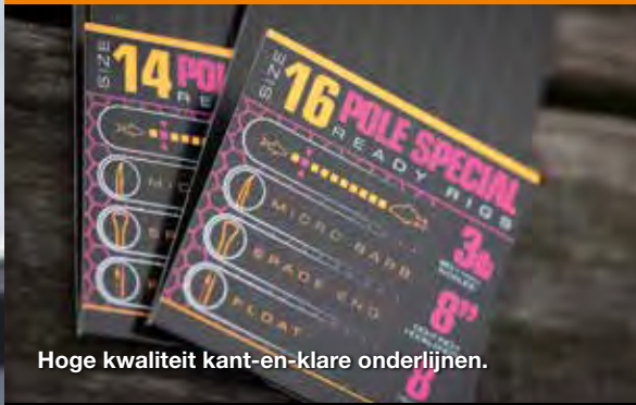
Hoge kwaliteit kant-en-klare onderlijnen.

de partij en deze begint het vissen behoorlijk vervelend te maken. Het is hoog tijd om de dag af te sluiten en lekker voor de warme kachel te gaan zitten. ■