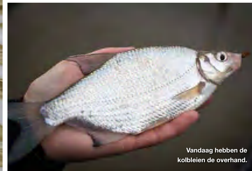
Vandaag hebben de kolbleien de overhand.