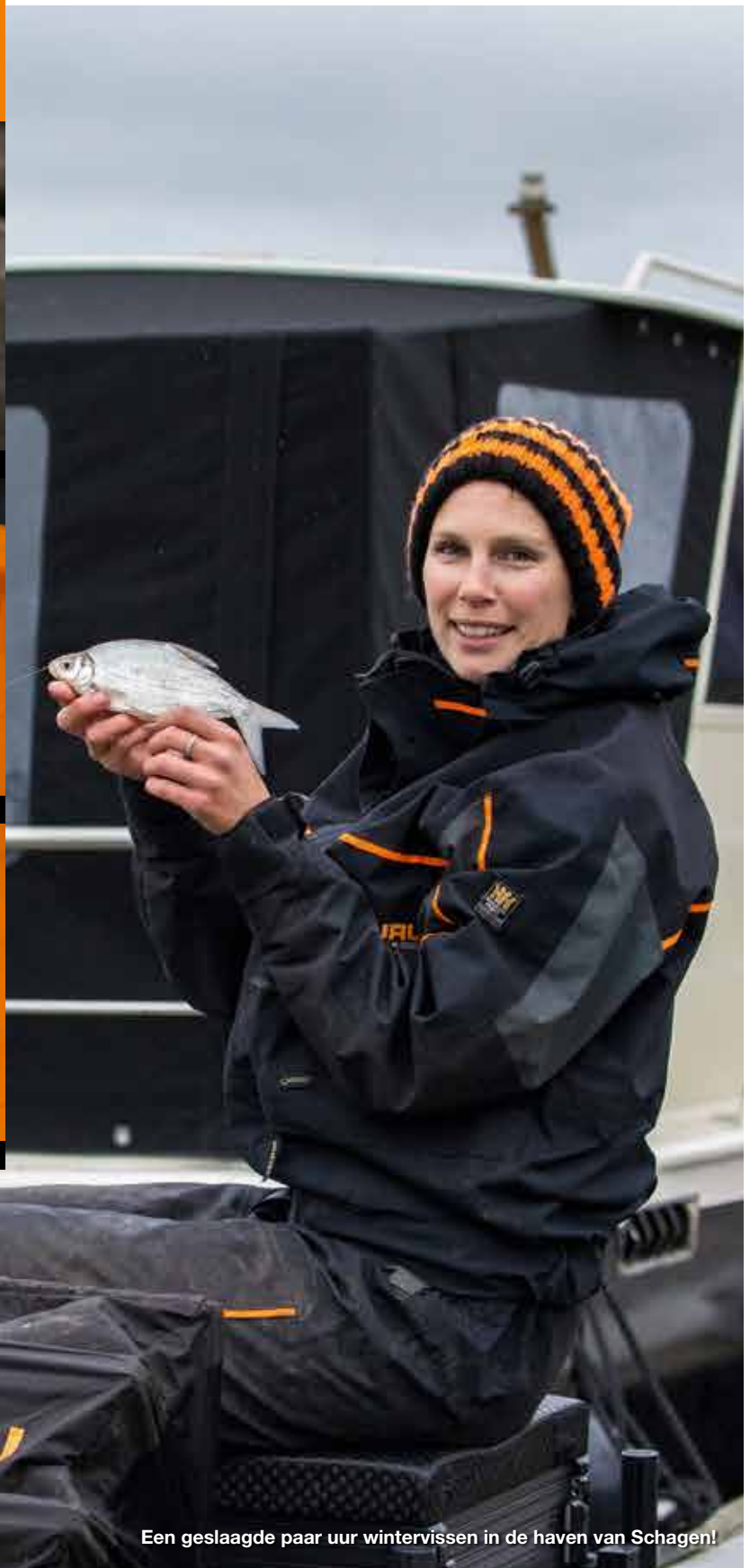
Een geslaagde paar uur wintervissen in de haven van Schagen!