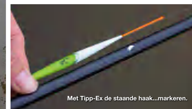
Met Tipp-Ex de staande haak...markeren.

begin goed vangt, gedurende de dag niet meer productief is, dan moet je gaan variëren in diepte. Voor deze sessie heb ik een mooi plekje gekozen vlak langs een boot. Wanneer er boten liggen is het altijd verstandig om hierbij in de buurt te vissen. De vis ligt hier vaak stijf tegenaan.