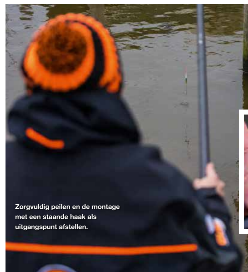
Zorgvuldig peilen en de montage met een staande haak als uitgangspunt afstellen.

Bij deze visserij is het belangrijk om de dobber exact 'staande haak' uit te peilen