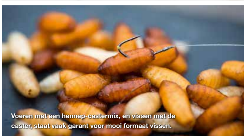
Voeren met een hennep-castermix, en vissen met de caster, staat vaak garant voor mooi formaat vissen.