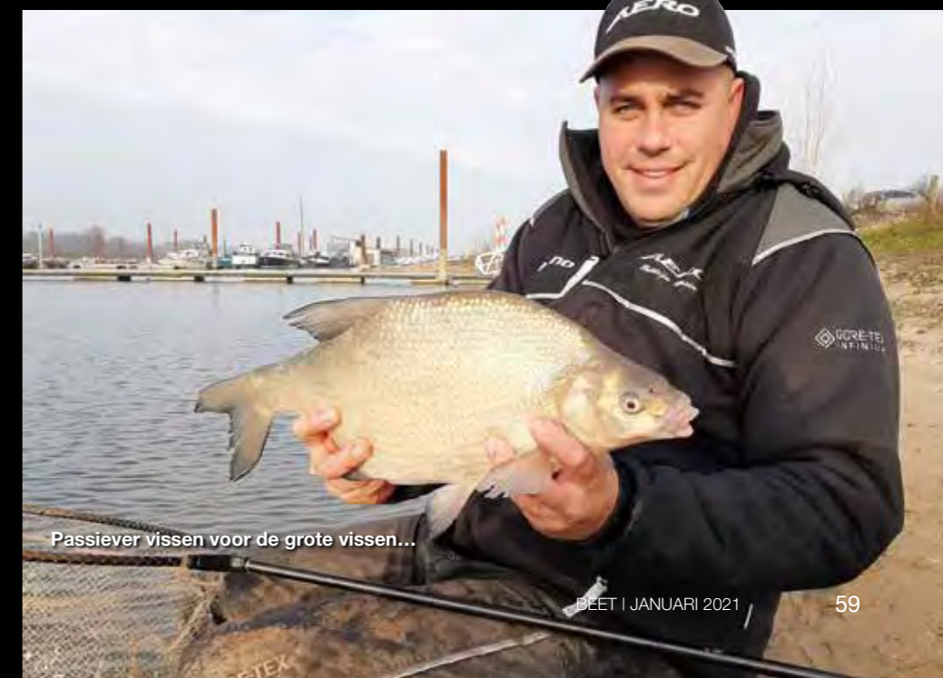
Passiever vissen voor de grote vissen...