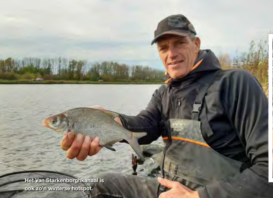
Het Van Starckenborghkanaal is ook zo'n winterse hotspot.