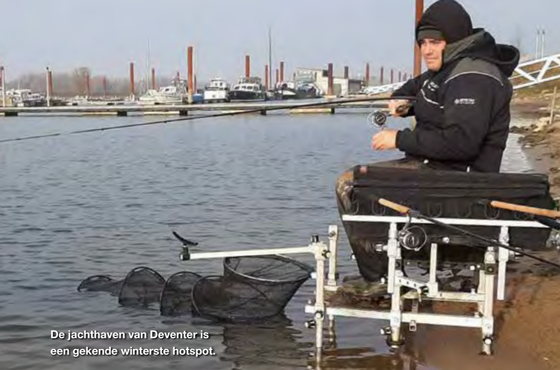
De jachthaven van Deventer is een gekende winterste hotspot.