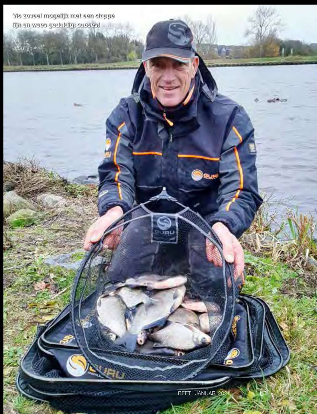
Vis zoveel mogelijk met een slappe lijn en wees geduldig; succes!

Vis met kleine korfjes maar blijf wel regelmatig ingooien, dit werkt beter dan een grote korf die je langer laat liggen. Voeg 25 % lichte leem aan je feedervoer toe, dit verschraalt het voer en heeft een licht wolkend effect waardoor ook andere vissen aange trokken worden. Wissel regelmatig van haakaas wanneer de beten uitblijven. Vis zoveel mogelijk met een slappe lijn als de stroming dit toelaat, met een slappe lijn heeft de vis nog minder weerstand bij het oppakken van het aas. Wees geduldig wanneer je in het begin van de sessie geen aanbeten krijgt, vaak duurt het langer in deze periode voordat de vissen op het voer komen. ■