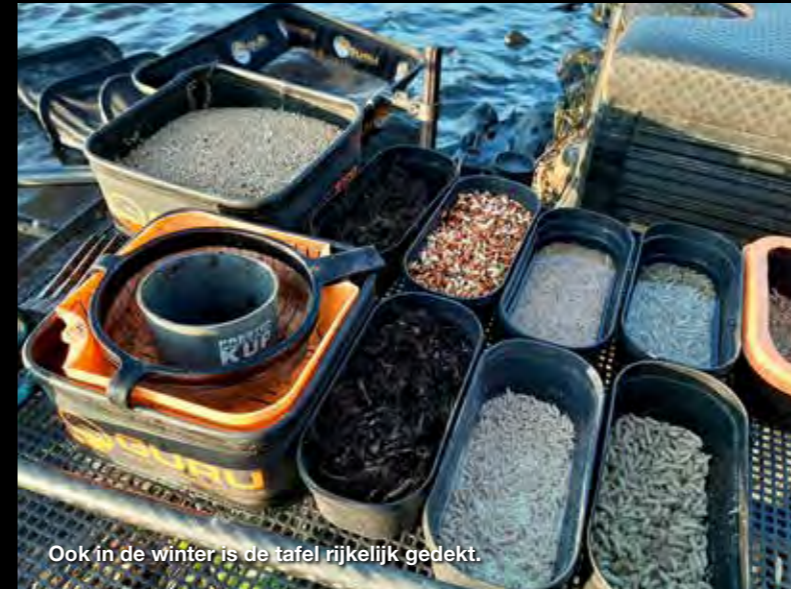
Ook in de winter is de tafel rijklijk gedekt.