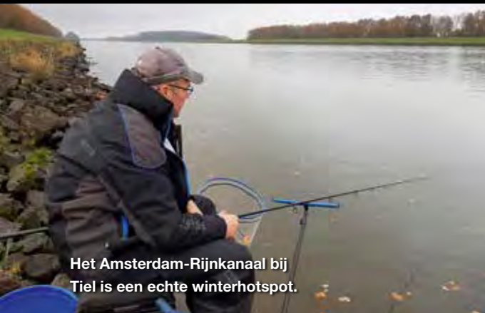
Het Amsterdam-Rijnkanaal bij Tiel is een echte winterhotspot.