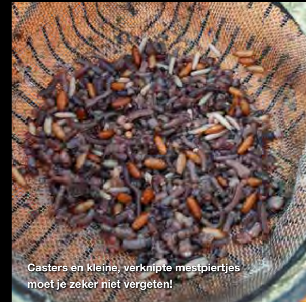
Casters en kleine, verknijpte mestpiertjes moet je zeker niet vergeten!