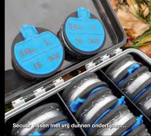
Secuur vissen met vrij dunnen onderlijnen...