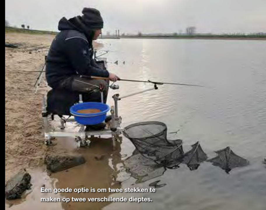
Een goede optie is om twee stekken te maken op twee verschillende dieptes.

Kennis van het water helpt natuurlijk bij het kiezen van de beste stek of stekken. Verschillende vissoorten kunnen zich in verschillende dieptes ophouden. Zo kan het best zijn dat er bijna geen brasem of blik is en dat je op een ondiepe stek wel voorn kan vangen voor een goede uitslag of leuke visdag. De dieptes ken ik dus vaak al voor een wedstrijd, alleen het zoeken naar de juiste plek zal toch met de feederhengel en een korf of lood moeten gebeuren. Op verschillende afstanden ingooien en goed tellen hoelang het duurt alvorens de korf de bodem bereikt, geeft al snel een beeld van het diepteverloop. Een vlak gedeelte net voorbij een talud is altijd een goede stek. Een goede optie is om twee stekken te maken op twee verschillende dieptes. Dat houdt je opties open.