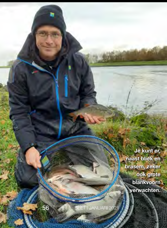
Je kunt er, naast blik en brasem, zeker ook grote blankvoorn verwachten.