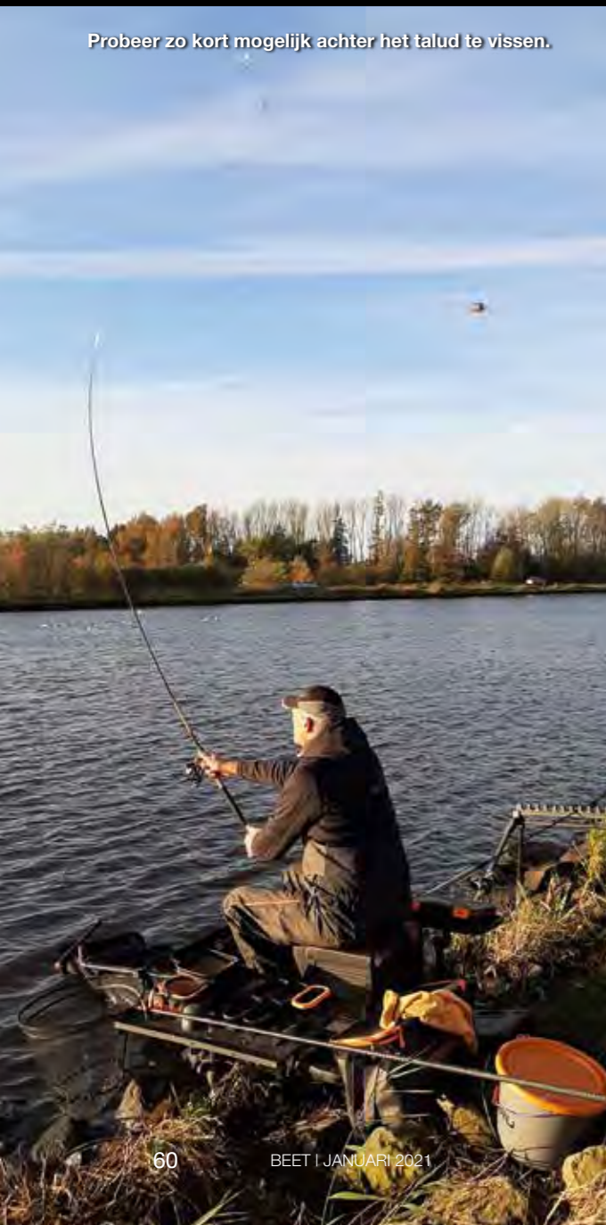
Probeer zo kort mogelijk achter het talud te vissen.