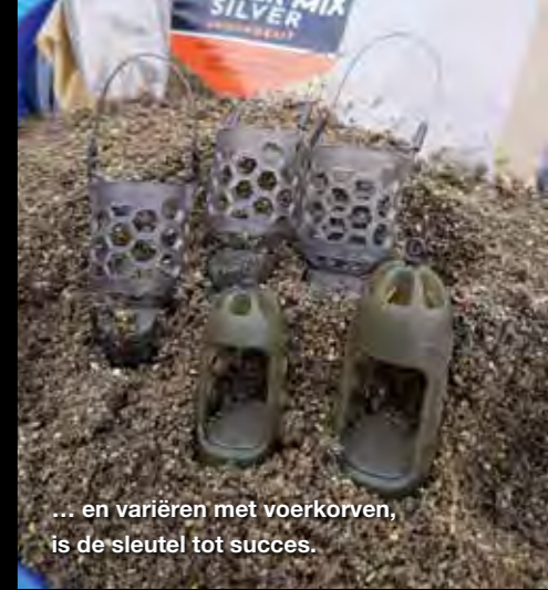
... en variëren met voerkorven, is de sleutel tot succes.

afhankelijk van de waterstand. Deze schommelt mee met het waterpeil van de Waal. Hoog water in de winter heeft vaak een positief effect op de vangsten.