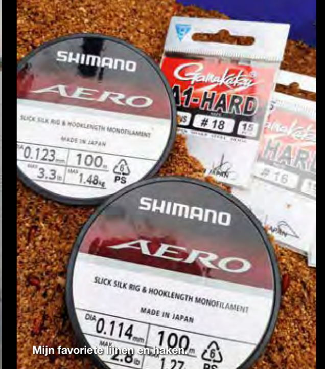
Mijn favoriete lijnen en haken.