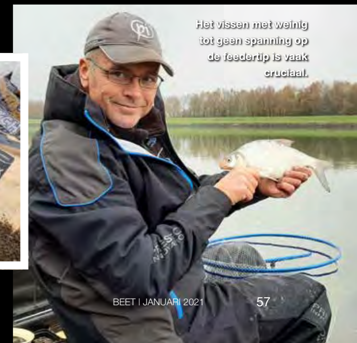
Het vissen met weinig tot geen spanning op de feedertip is vaak cruciaal.