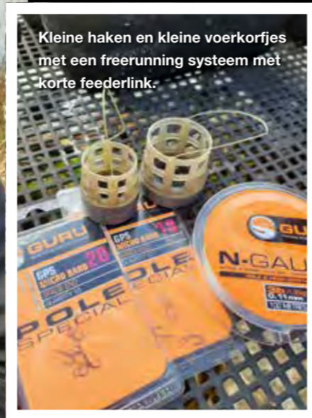
Kleine haken en kleine voerkorfjes met een freerunning systeem met korte feederlink.