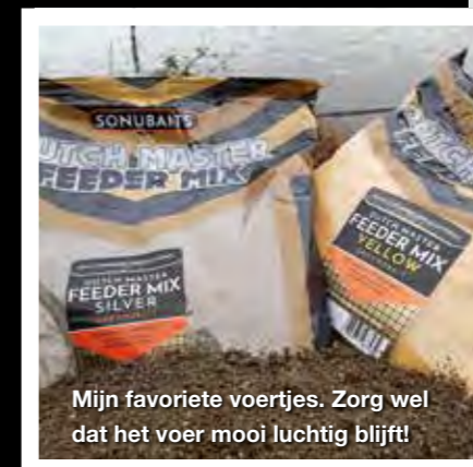
Mijn favoriete voertjes. Zorg wel dat het voer mooi luchtig blijft!

Verminder de weerstand! Vaak wordt de feedertop geheel strak gedraaid tot deze zelfs krom en onder spanning staat. Dit geeft bij het opnemen van het aas natuurlijk weerstand aan een azende vis. Probeer ook eens een 'losse' top, ook wel 'loose line' (losse lijn) genoemd. Je draait na het ingooien de lijn strak en verschuif dan de hengel zodanig dat de tip van de feeder niet meer direct onder spanning staat. Heel vaak volgt er dan een prachtige aanbeet! Staat er wat meer stroming, dan zal je actiever en uit de hand moeten vissen, probeer maar eens. Succes!