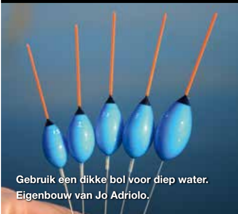
Gebruik een dikke bol voor diep water. Eigenbouw van Jo Adriolo.

Bij montages 1/m 1 gram gaat Danny voor een 10/00 hoofdlijn. Zwaarder dan 1 gram een 12/00 hoofdlijn. De onderlijnen zijn 02/00 dunner dan de hoofdlijn. Op de topsets voor voorn zit een 0,9 mm elastiek, dit is zo perfect in balans. De zwaardere brasemtopset is standaard uitgerust met een 1,0 mm elastiek en een 12/00 hoofdlijn.