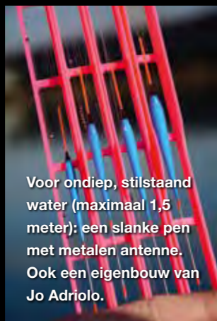
Voor ondiep, stilstaand water (maximaal 1,5 meter): een slanke pen met metalen antenne. Ook een eigenbouw van Jo Adriolo.