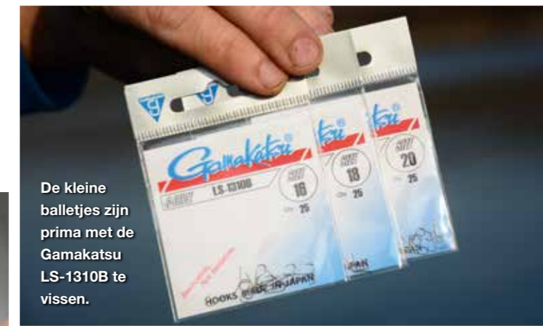
De kleine balletjes zijn prima met de Gamakatsu LS-1310B te vissen.