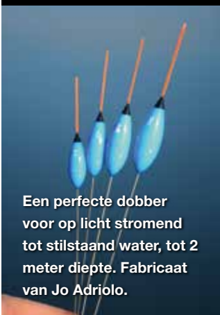
Een perfecte dobber voor op licht stromend tot stilstaand water, tot 2 meter diepte. Fabricaat van Jo Adriolo.