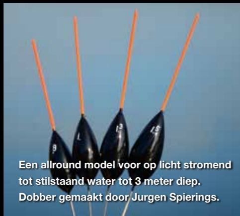
Een allround model voor op licht stromend tot stilstaand water tot 3 meter diep. Dobber gemaakt door Jurgen Spierings.