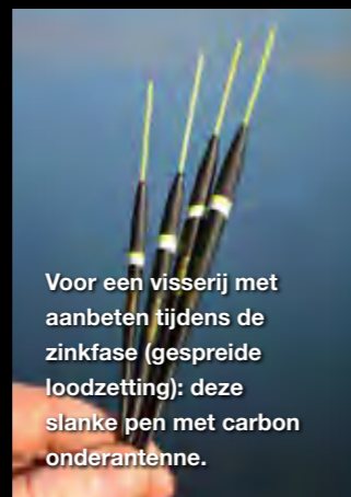
Voor een visserij met aanbeten tijdens de zinkfase (gespreide loodzetting): deze slanke pen met carbon onderantenne.

voornvisserij op ongeveer 17 meter. Het feedervoer is, zoals hij het zelf zegt, minder 'spannend' dan het voer van Danny voor de vaste hengel. In het kort: een mix van Champion Feed Wonder Bronze en Gros Gardon, in de verhouding 2:1. Op 3 kg van deze mix voegt Lucien 300 gram vers gemalen venkelzaad toe. Om het voer af te maken een goede hand gele en oranje boilie crush. Een absoluut hoogstandje in eenvoud en perfectie is de opbouw van de feeder Montage. Dat ligt grotendeels door het uitgekiende kleinmateriaal uit het gamma van Cresta. Lucien vist met een schuivende montage. De voerkorf hangt in een kraalwartel die precies aansluit tegen een stopper. De stopper wordt op zijn plaats gehouden door een 'gefixeerd stuitje'. Daar onder nog een stukje lijn dat fungeert als afhouder en tot slot de onderlijn. Deze is ongeveer 60 cm lang. Een montage die er heel netjes en strak uitziet en voor voorn goed werkt.