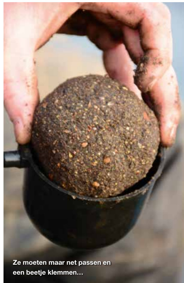
Ze moeten maar net passen en een beetje klemmen...

Over het onderwerp voerballen maken heeft Danny ook nog enkele