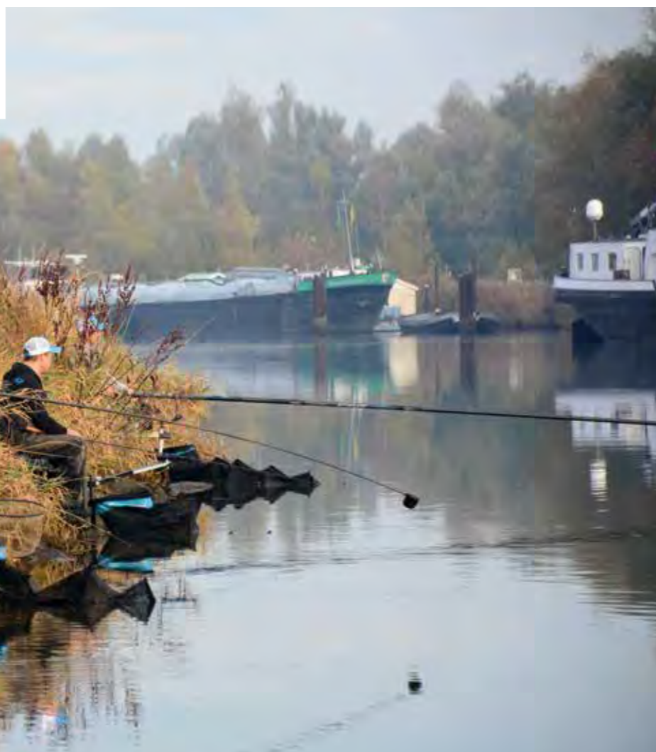
De voerballen worden zorgvuldig op de stek gecupt.