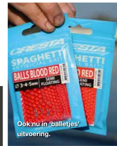
Ook nu in 'balletjes' uitvoering.

Danny pakt een topset met een gespreide loodzetting erbij en kort deze in tot een visdiepte van nauwelijks een meter, alwaar het water ruim twee meter diep is. "Het is belangrijk om een dobber met carbon onderantenne te gebruiken. Wanneer je de montage gestrekt inwerpt, ik haal straks een hengeldeel er af, zakt de vislijn inclusief dobber in een rechte lijn. Een dobber met stalen antenne zal direct verticaal gaan staan, waardoor er een gekke hoek in de lijn ontstaat en je aanbeten tijdens het zakken mist." De rode Cresta Spaghetti Balls in combinatie met één made wordt razendsnel opgemerkt en Danny landt vis na vis. Dat deze balletjes semi-drijvend zijn helpt ook om het haakaas tergend langzaam te laten zakken. Lucien schakelt over van een 25 grams korf naar een kleine plastic gaaskorf van 10 gram om de zinkfase