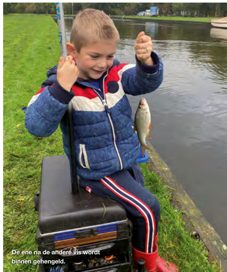
De ene na de andere vis wordt binnen gehengeld.