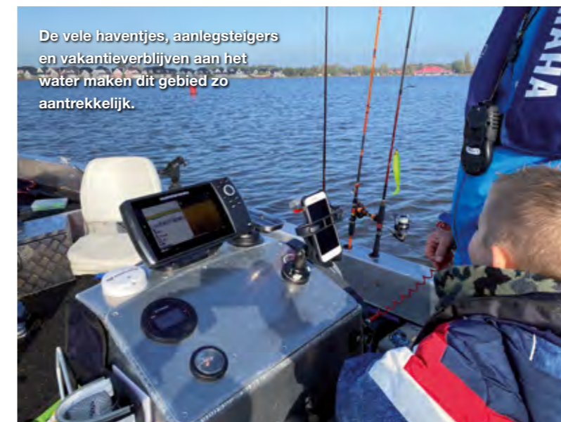
De vele haventjes, aanlegsteigers en vakantieverblijven aan het water maken dit gebied zo aantrekkelijk.