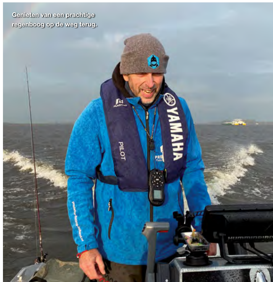
Genieten van een prachtige regenboog op de weg terug.