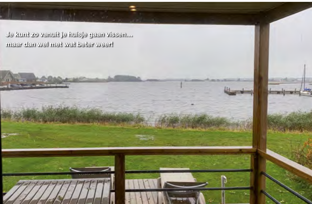
Je kunt zo vanuit je huisje gaan vissen... maar dan wel met wat beter weer!