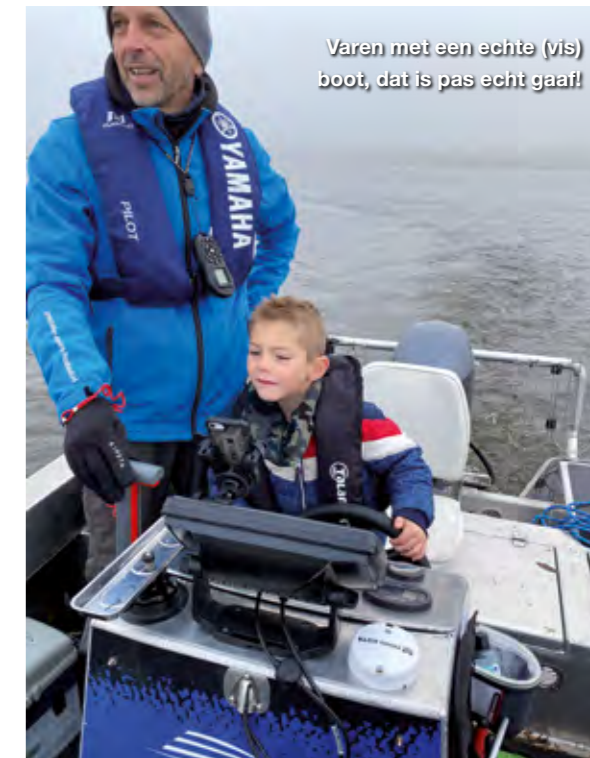
Varen met een echte (vis) boot, dat is pas echt gaaf!

N aast het vissen is het natuurlijk belangrijk dat er ook andere uitstapjes mogelijk zijn. RCN De Potten in Offingawier paste precies in het plaatje met Sneek op slecht enkele kilometers afstand.