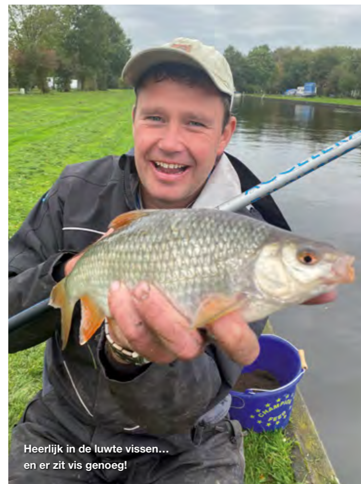
Heerlijk in de luwte vissen... en er zit vis genoeg!