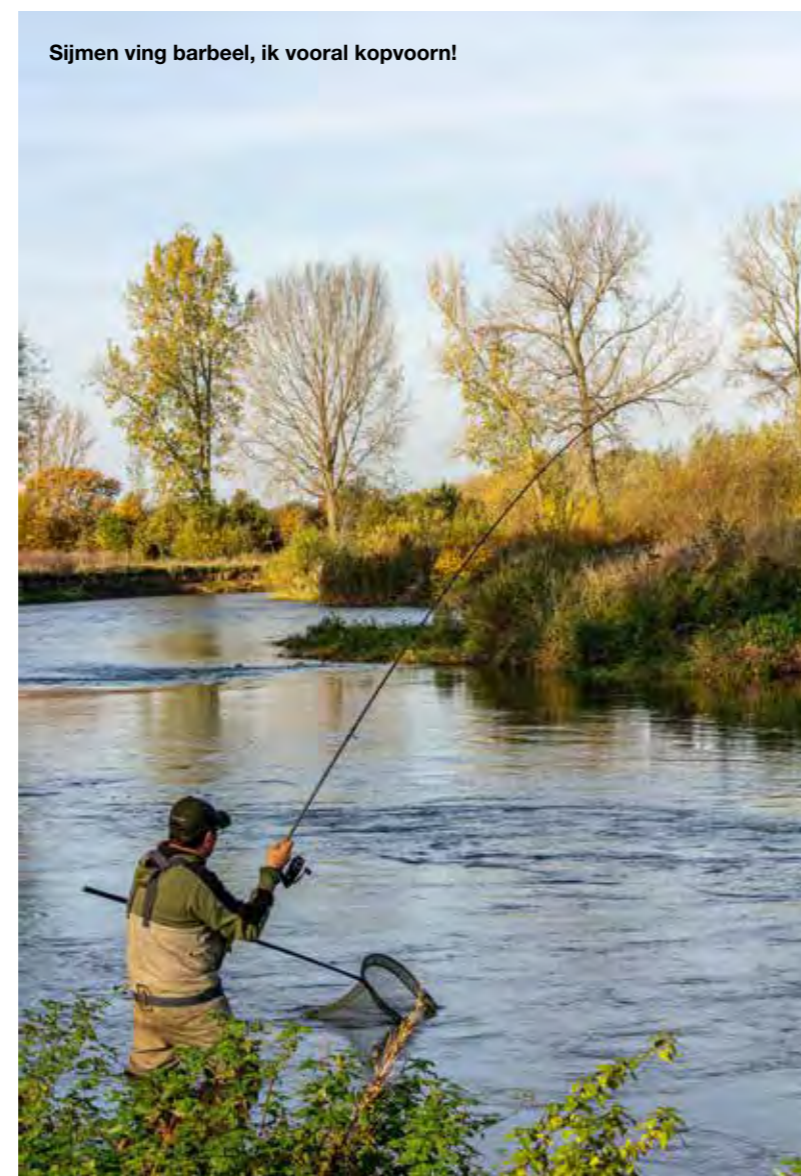
Sijmen ving barbeel, ik vooral kopvoorn!

gemaakt. De dropshotmontage met kaasdeeg of luncheon meat vist een stuk selectiever als je je pijlen richt op kopvoorn. ■