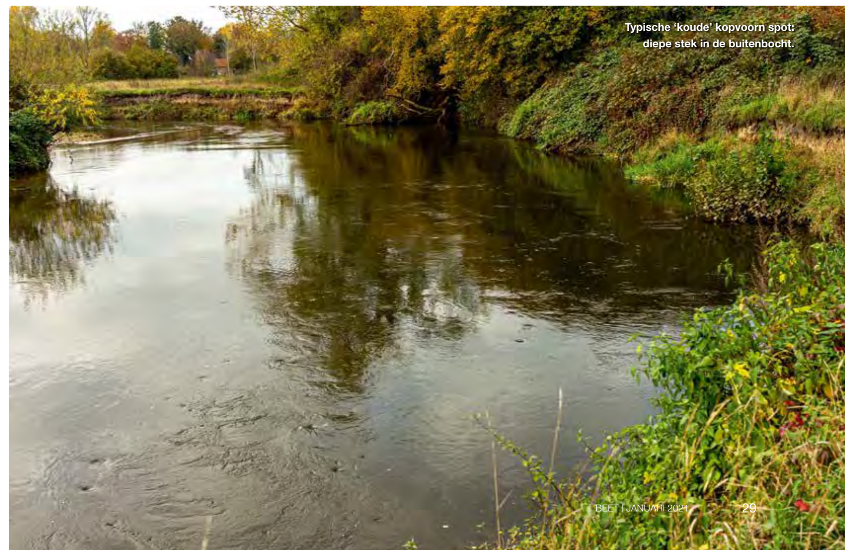
Typische 'koude' kopvoorn spot: diepe stek in de buitenbocht.

shotloodje wordt zo licht mogelijk gekozen, maar zo zwaar als het moet. Het is de bedoeling dat na het inwerpen het lood zich heel langzaam of niet verplaatst in de stroming. Het is niet te geloven hoe licht je hiermee kunt vissen. Zelden gebruik ik zwaarder dan 10 gram lood. De hengel die ik hiervoor meestal gebruik is een lichte feederhengel met een 2 oz tip. Als ik ook barbeel verwacht, dan gebruik ik de Korum Barbel Quiver. Ik heb afgelopen jaar al meerdere barbelen mogen vangen met deze