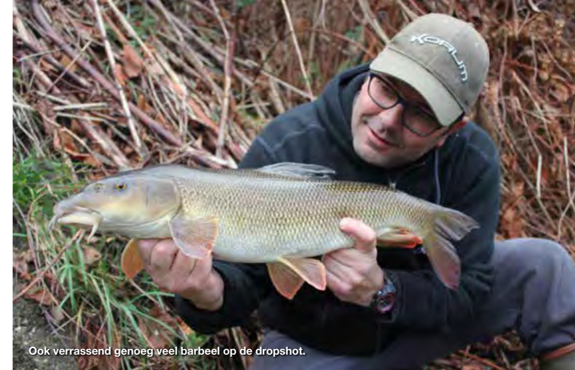
Ook verrassend genoeg veel barbeel op de dropshot.

een soort van euforische stemming omdat het een kopvoorn was van ruim een halve meter. Niet veel later wist ik er nog een te vangen die zelfs 58 cm lang was, terwijl Sijmen met zijn bodemmontage uitblonk in het vangen van barbeel. Het was opvallend om enerzijds te zien dat je met de dropshotmontage selectiever vist als je je zinnen hebt gezet op kopvoorn. Anderzijds was dit een zeer opvallende dag omdat ik het tot tweemaal meemaakte dat ik een barbeel op 40 cm boven de bodem ving met dezelfde dropshotmontage. Op zich was dat ook wel een openbaring voor ons allebei. Op de tweede stek zijn we wederom op dezelfde manier gestart als op de eerste stek. Een stief halfuurtje later wist ik mijn derde kopvoorn van de dag te vangen, op de dropshot met kaasdeeg. Mijn dag kon niet meer stuk. Dit was voor Sijmen het moment om de switch te maken