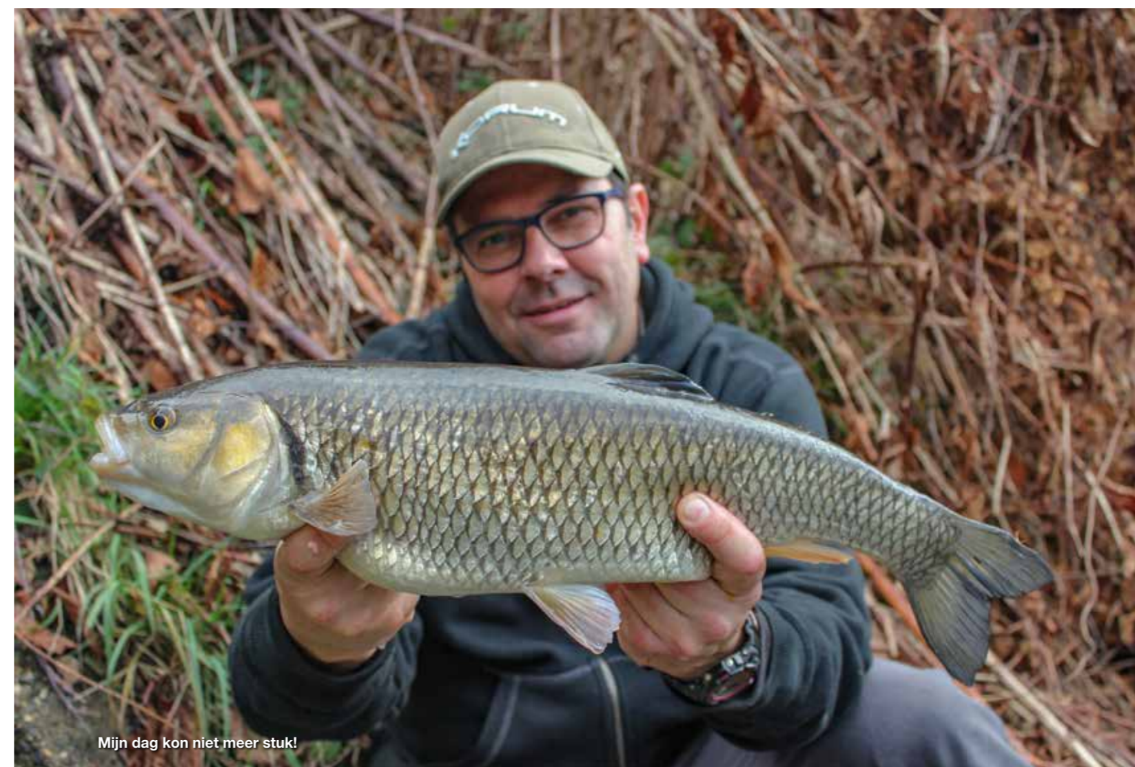
Mijn dag kon niet meer stuk!