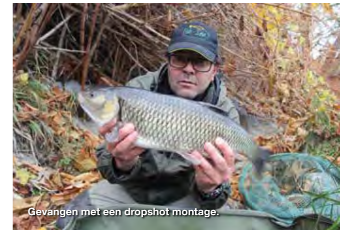
Gevangen met een dropshot montage.