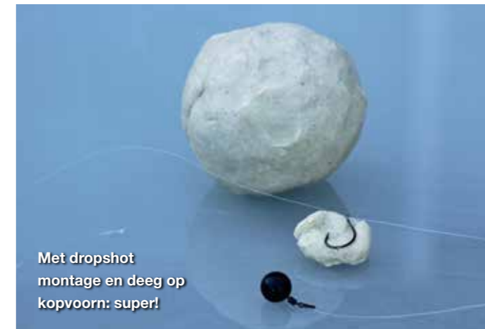
Met dropshot montage en deeg op kopvoorn: super!

korter. Als de visserij taaier blijkt te zijn, dan zou ik wel eens langer dan een meter kunnen gaan vissen. Enfin, wat dat betreft niks nieuws onder de zon. Mijn haken zijn te allen tijde redelijk grote haken. De favoriet is een haak nummer 6. De Korum Grappler en de Allrounder zijn top voor de kopvoornvisserij.