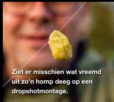
Ziet er misschien wat vreemd uit zo'n homp deeg op een dropshotmontage.