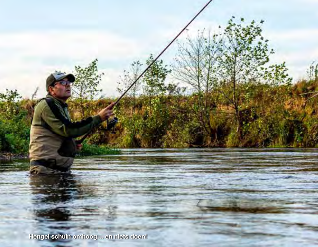
Hengel schuin omhoog... en niets doen!