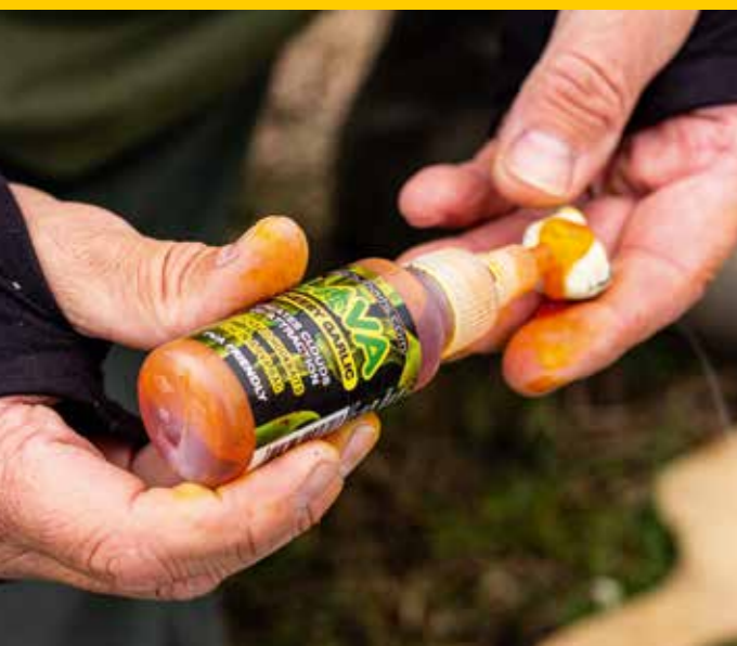
Voor extra attractie een smeer Cheesy Garlic Lava.

brood te vers zijn, dan laat ik het een dag uit de verpakking drogen. Vervolgens maak ik er kleinere stukken van en die stop ik in de blender. Even de blender laten gieren en klaar is kees. Het resultaat is een heel luchtig witbroodkruim dat ik iets bevochtig aan het water alvorens ik het in de voerkorf of gripper lead prop. Als ik het brood thuis bevochtig, dan doe ik dat graag met een plantensproeier waarin ik een flavour op waterbasis toevoeg. In het water ontsnappen de aangedrukte broodkruimels en die zorgen ervoor dat er constant iets te vinden is in de buurt van het aas. De stroming zelf zorgt weer voor de verspreiding van de kruimels. De aanwezige kopvoorns houden er heel erg van.