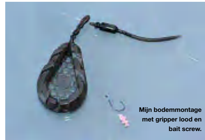
Mijn bodemmontage met gripper lood en bait screw.

soort waarmee ik vis. Ik wissel dus nog wel eens van onderlijn, maar ook dat is met een running rig montage een fluitje van een cent. Mijn onderlijnen zijn gemaakt van fluorocarbon, variërend van 22/00 tot 28/00. Dunner of dikker ga ik nooit. Ik maak ze ongeveer een meter lang. Mocht het nodig zijn, dan kan ik ze altijd nog iets inkorten aan het water. Zeker als er veel en harde aanbeten komen, dan maak ik altijd mijn onderlijnen