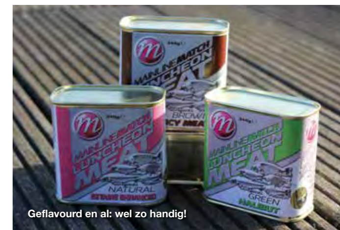
Geflavourd en al: wel zo handig!