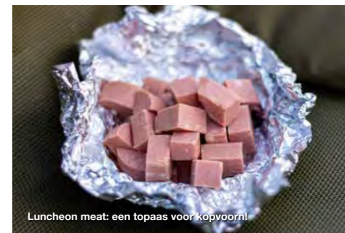
Luncheon meat: een topaas voor kopvoorn!

goed invriezen voor een volgende keer. Ook gebruik ik vaak 'Spam', omdat dit merk blikvlees erg goed direct op de haak te vissen is en dat is ideaal voor de dropshot methode. Ik maak daarvan kleine blokjes en vries deze minimaal 48 uur in, voorzien van de Sonubaits Luncheon Meat flavour. Een betere combinatie ken ik persoonlijk niet. Als ik met een loodje of korf vis, dan gebruik ik graag een Korum screw om eenvoudigweg het blokje vlees erop te schroeven. Het witbrood waarmee ik aan de haak vis bereid ik als volgt voor: ik ontdoe een stuk of zes sneden vers witbrood van de korsten en leg deze ongeveer tien seconden in de magnetron. Daarna 'plet' ik de sneetjes met de deegroller en verpak ze dan zo strak mogelijk in vershoudfolie. Het brood wordt hierdoor plakkerig en dat leent zich uitermate voor montage. Als vul-ling voor de voerkorf of het grippeer lead gebruik ik graag oud witbrood. Ik koop een goedkoop gesneden witbrood (bij voorkeur oud) en dat ontdoe ik van alle korsten. Mocht het