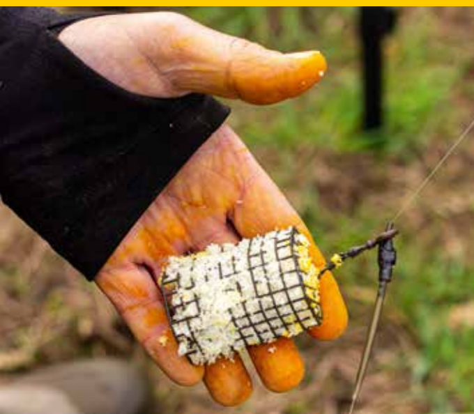
... voor in een voerkorf.