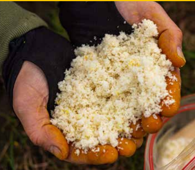
Luchtig witbroodkruim, perfect als voer...