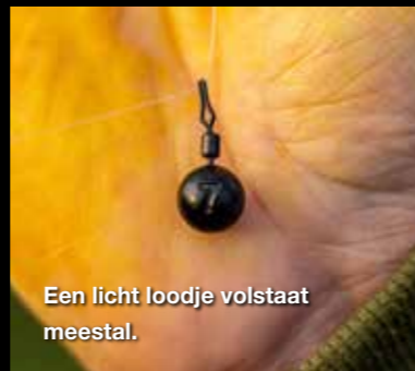
Een licht loodje volstaat meestal.