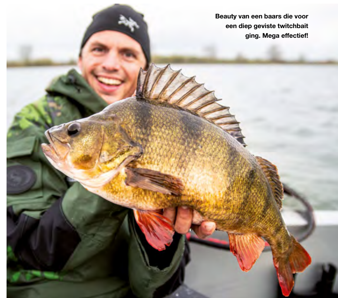
Beauty van een baars die voor een diep geviste twitchbait ging. Mega effectief!