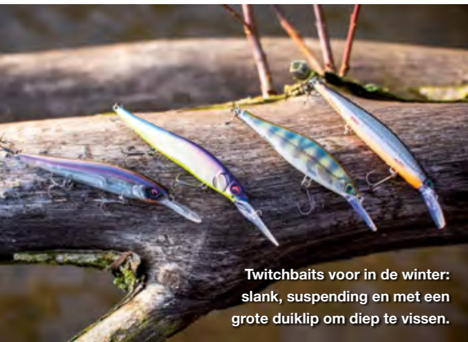
Twitchbaits voor in de winter: slank, suspending en met een grote duikclip om diep te vissen.

finesse dan een Carolina rig. Je vist altijd met super lichte jigheads, eigenlijk is 5 gram al te veel. Daarnaast kun je het aasje heel direct en subtiel actie geven, en vooral extreem traag vissen. Laat maar naar de bodem zakken, en laat hem gewoon 10 seconden staan. Zelfs als het aasje stil staat op de bodem is het een killer. Op stekken waarvan je weet dat er vis ligt, en de C-rig geen vis oplevert zeker eens het proberen waard. Het heeft ons zo ook al schitterende vissen opgeleverd! Een kanttekening is wel op zijn plaats, en ook de reden dat wij dit aasje zo lang niet geprobeerd hebben op de grote wateren: bij harde wind, diep water of op momenten dat je lange worpen moet maken is dit aasje niet geschikt. Daar is het gewoon te