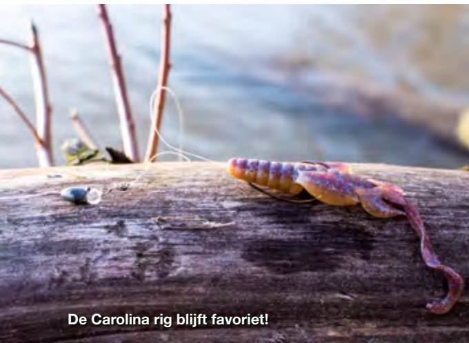
De Carolina rig blijft favoriet!

Het ziet er voor de visser echt niet aantrekkelijk uit, maar gebleken is dat deze presentatie voor de baarzen onweerstaanbaar kan zijn!