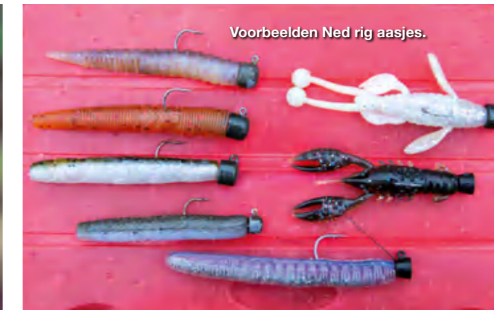
Voorbeelden Ned rig aasjes.

Tim ving deze prachtbaars op een vrij forse creature bait, niet zelden is dat de truc.