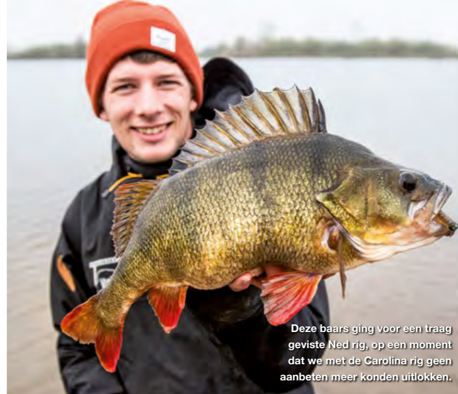
Deze baars ging voor een traag geviste Ned rig, op een moment dat we met de Carolina rig geen aanbeten meer konden uitlokken.

Wat ons betreft is de baars de allermooiste zoetwatervis van Nederland en in de winter worden ze alleen maar mooier!