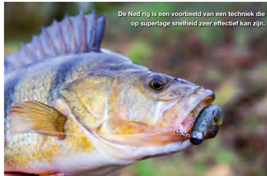
De Ned rig is een voorbeeld van een techniek die op superlage snelheid zeer effectief kan zijn.

Een Ned rig bestaat uit een klein (maximaal 7,5 cm), drijvend rubberen aasje, meestal in de vorm van een staafje. Dit aasje is gerigd op een afgeplatte jighead. Door de jighead en het drijfvermogen blijft dit aasje altijd rechtop op de bodem staan. Het ziet er voor de visser echt niet aantrekkelijk uit, maar gebleken is dat deze presentatie voor de baarzen onweerstaanbaar kan zijn! In onze ogen is dit aasje nóg meer