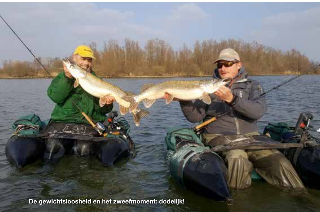
De gewichtsloosheid en het zweefmoment: dodelijk!