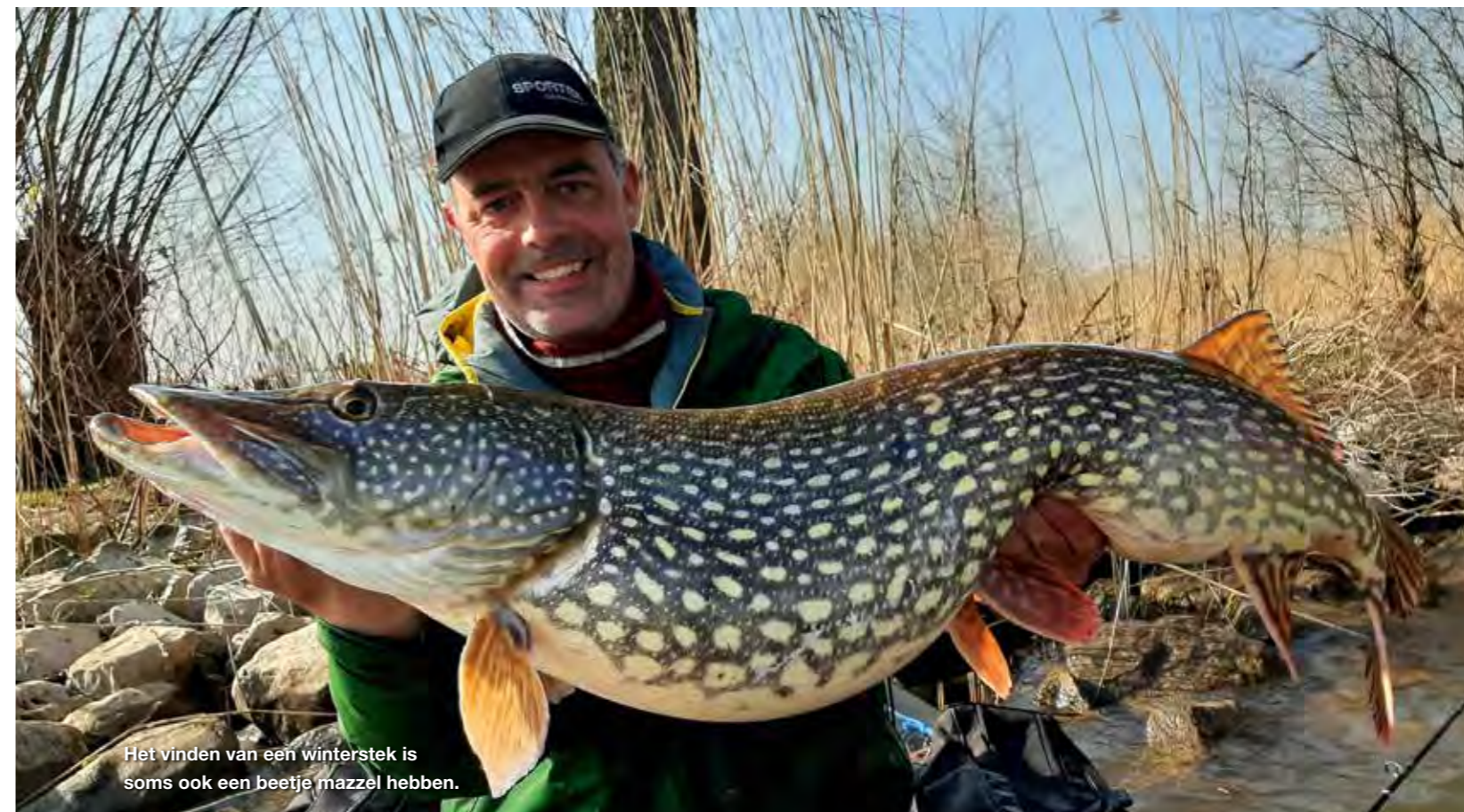
Het vinden van een winterstek is soms ook een beetje mazzel hebben.

houden we zo'n plek, want dat doen de snoeken ook! Een water moet je leren kennen, nog een cliché, en om er direct nog een tegenaan te gooien: dat lukt niet in één seizoen en ook niet in twee. Snoeken liggen nooit zomaar ergens. Eten en voortplanten, dat is waar het leven om draait. En dat bepaalt waar ze zich ophouden in een bepaalde periode. Dat eten en voortplanten geldt ook voor hun prooi en dat geldt ook weer voor de prooi van de prooi... Zo is de voedselketen ooit bedacht. Nu nog uitvinden waar en wanneer welke activiteit plaatsvindt. In de wintermaanden trekken de