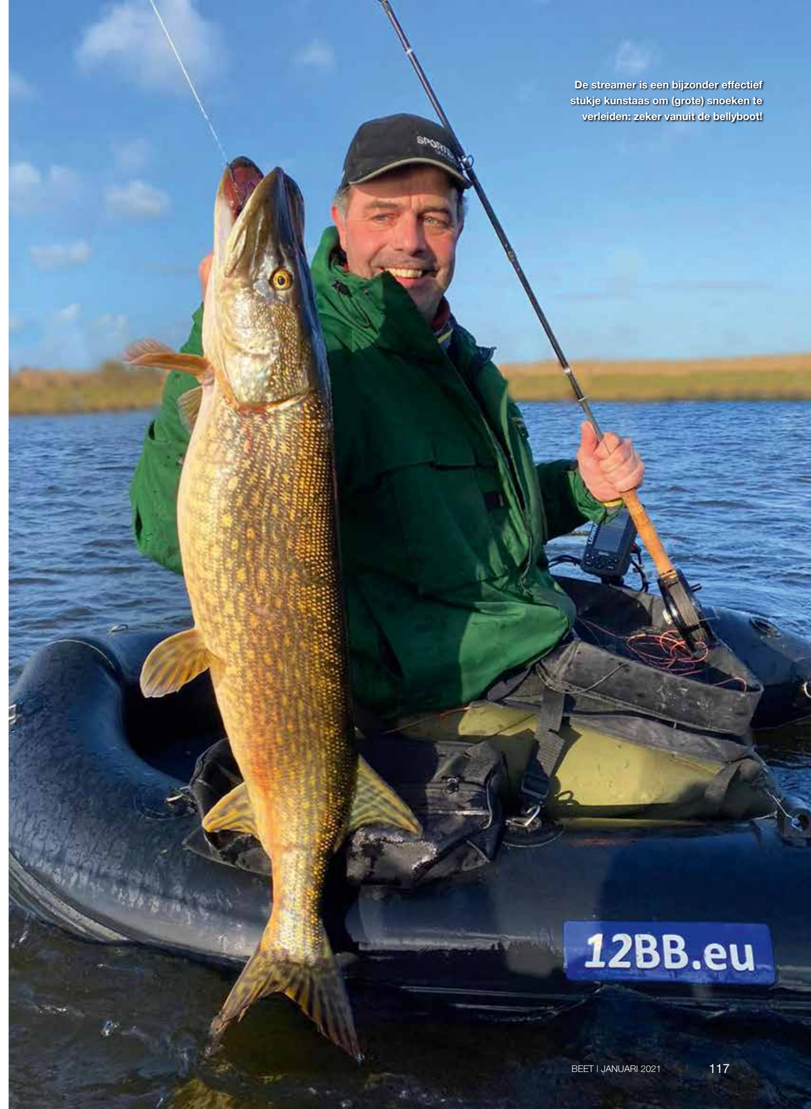
De streamer is een bijzonder effectief stukje kunstaas om (grote) snoeken te verleiden: zeker vanuit de bellyboot!