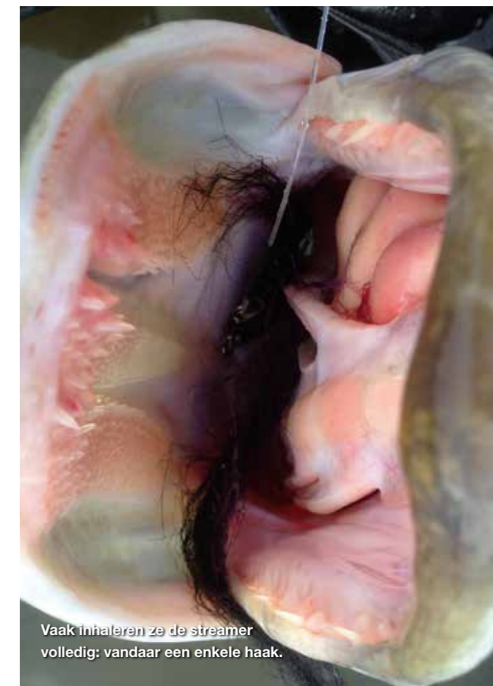
Vaak inhaleren ze de streamer volledig: vandaar een enkele haak.

Mijn denkwijze over streamers is simpel, heel simpel. Ik gebruik eigenlijk maar twee soorten: zwart en wit, that's it. Zwart ligt iets genuanceerder, namelijk een zwart en paars gemixte streamer. De voorliefde voor die kleuren gaat terug naar de jaren 90. Het was in Ierland om precies te zijn. Op die kleurencombi ving ik, uiteraard vanuit de bellyboot, mijn eerste grootwatersnoeken. Destijds waren ze gemaakt van bucktail, tegenwoordig maak ik ze van Dyckers Fibers. Dit is een mooie kunststof fiber waarmee het makkelijk binden