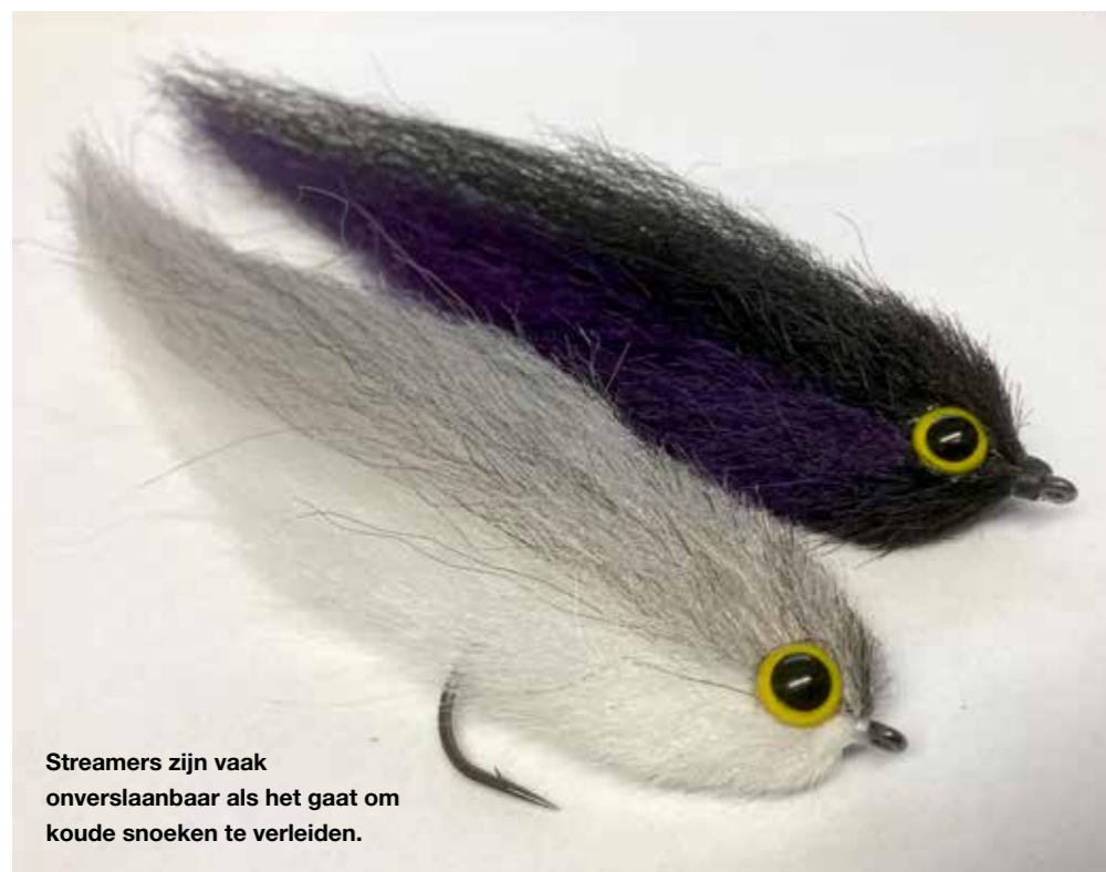
Streamers zijn vaak onverslaanbaar als het gaat om koude snoeken te verleiden.

Twee van mijn vismaten vissen met enige regelmaat samen op snoek. De één altijd met kunstaas, de ander bijna altijd met de streamer. 'Fly versus Jerk'. Dezelfde omstandigheden, zelfde plek en zelfde moment. Ik weet de exacte 'stand' niet, maar ik weet wel dat de streamer het vaakst de snoeken verleidt. Kortom, de streamer is een bijzonder effectief stukje kunstaas om snoeken te verleiden. Combineer dat met een bellyboot, waarmee je zeer precies en lekker langzaam kan varen en je hebt een combi die voor elkaar gemaakt is! Daarom vis ik graag vanuit de bellyboot op snoek. Met de streamer. En op groot water.