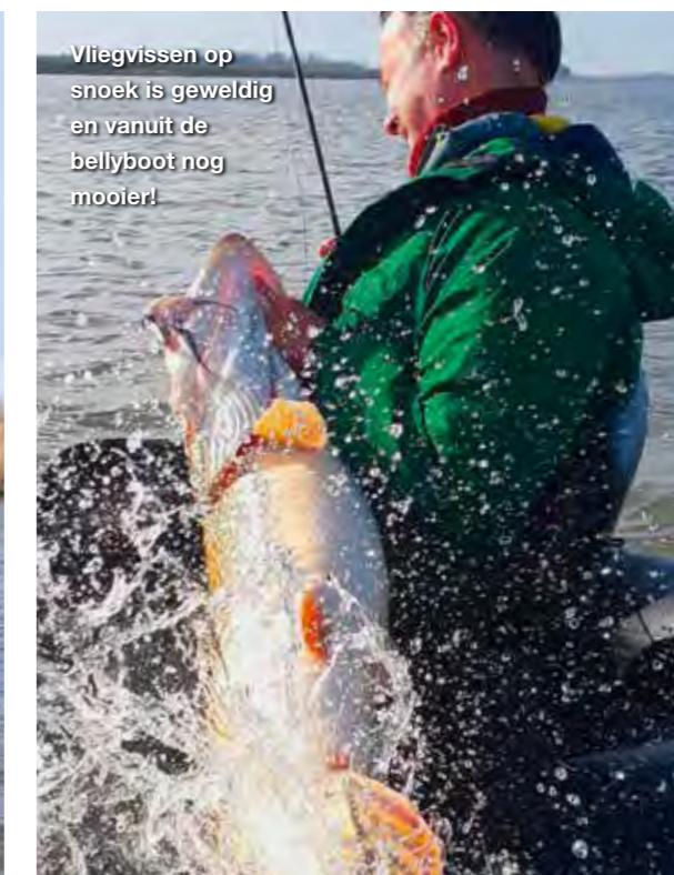
Vliegvisserij op snoek is geweldig en vanuit de bellyboot nog mooier!