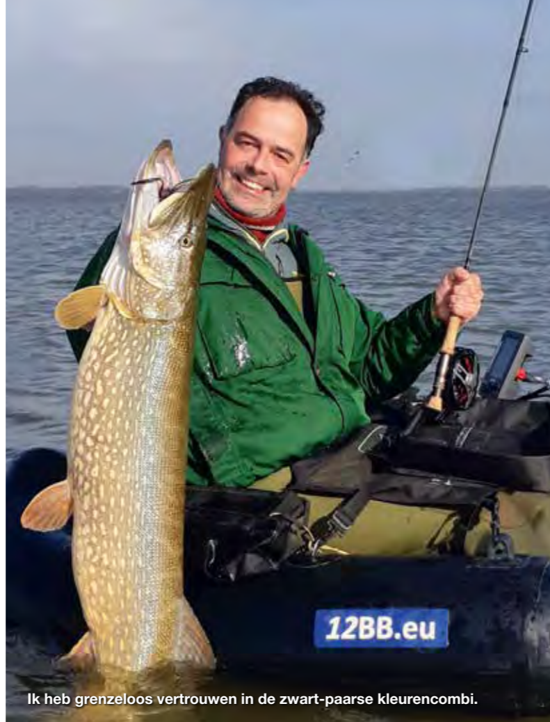
Ik heb grenzeloos vertrouwen in de zwart-paarse kleurencombi.

Wisselen doe ik nauwelijks, dus daar verlies ik ook geen tijd mee. Voor mij geen streamers met glitters/flash, allerlei toeters en bellen of in knal-kleuren. Natuurlijk vangen ze, maar had ik al gezegd dat ik van simpel houd? Bovendien denk ik dat streamers met overmatig veel glitters en/of in felle kleuren de dressuur bevordert in plaats van doorbreekt... Vis met iets waar je vertrouwen in hebt, dat is het belangrijkste. Probeer er maar eens een hele dag mee te vissen zon-