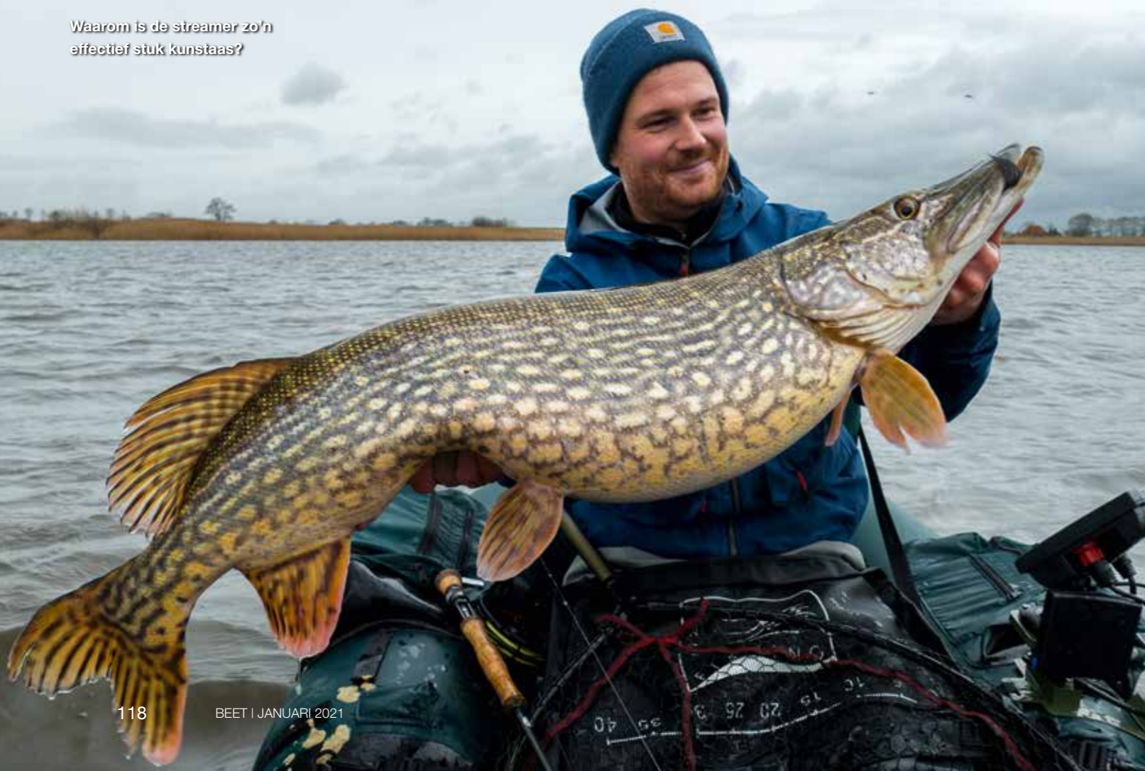
Waarom is de streamer zo'n effectief stuk kunstaas?

stukje binnen stript. De aanbeten zijn niet zelden heel subtiel. We vissen vlakbij de bodem en soms lijkt het alsof je ergens doorheen trekt of over de bodem schraapt. Ik heb het nogal eens afgedaan als mosselen of rommel, maar toch niet helemaal zeker van de zaak, even een variatie in binnenstrippen en een paar extra worpen over dezelfde stek. En dan toch vaak een echte aanbeet. Wat ik voelde waren geen mosselen of bodem, maar de tanden van een snoek die in het streamer materiaal blijven haken. Herken je het gevoel eenmaal, dan weet je ook hoe regelmatig de snoek aan de staart van je streamer 'plukt' zonder dat je een echte aanbeet krijgt! Soms is de pluk wat duidelijker of krijg je een subtiele slapgooier. Een totaal verfrommelde streamer bevestigt dat het toch echt een aanbeet was. Bovenstaande geeft duidelijk aan dat de snoeken soms heel voorzichtig kunnen zijn. Je kan dit (proberen) te voorkomen door meerdere haken of een stinger in je streamer te 'verstoppen', maar zelf houd ik daar niet van. Soms zijn de aanbeten namelijk