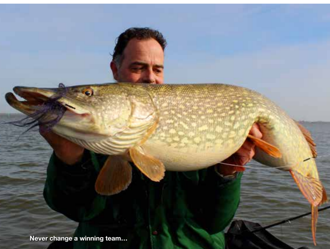
Never change a winning team...

Deze tussenkop is een eerste klas cliché, maar wel waar. De (grote) Nederlandse wateren hebben een prachtig bestand aan (grote) snoek. In de wintermaanden hokt de snoek graag samen en hierdoor kan je soms meerdere grote snoeken vinden in een klein gebied. En dat is mooi meegenomen. Een bellyboot is prachtig, maar snel ben je er niet in en ook qua actieradius is het niet top... Maar waar vind je die snoeken? De stek beschreven in het begin van dit artikel was een paaiestek; de snoeken waren massaal aanwezig om zich voor te bereiden op de paai. Maar waarom juist daar en niet 100, 200 of 500 meter verder, waar ook prachtige rietkragen staan? Tja, daarop moet ik het antwoord schuldig blijven; het is immers geen exacte wetenschap. Een gevalletje geluk. Uiteraard ont-